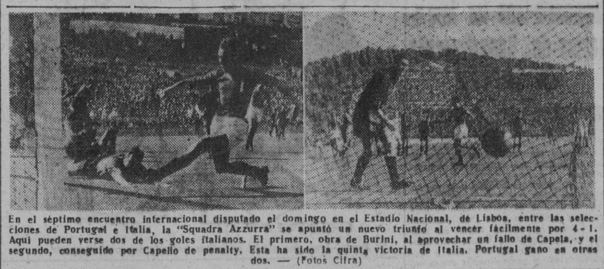
En el séptimo encuentro internacional disputado el domingo en el Estadio Nacional, de Lisboa, entre las selecciones de Portugal e Italia, la "Squadra Azzurra" se apuntó un nuevo triunfo al vencer fácilmente por 4-1. Aquí pueden verse dos de los goles italianos. El primero, obra de Burini, al aprovechar un fallo de Capela, y el segundo, conseguido por Capello de penalty. Esta ha sido la quinta victoria de Italia. Portugal gana en otras dos.