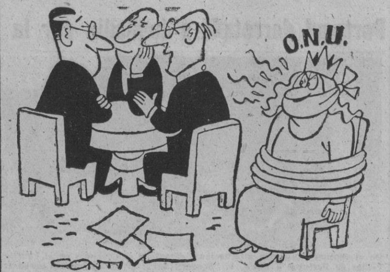
— Bueno, creo que ahora podremos entendernos perfectamente.