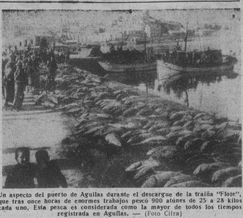
Un aspecto del puerto de Aguilas durante el descargo de la traña "Flote", que tras once horas de enormes trabajos pescó 900 atunes...