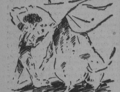
Una larga cambiada de Luis Miguel «Dominguín»

Estábamos en lo cierto, al llegar a la Monumental, ayer tarde, de que aquella muchedumbre que iba envolviendo, poco a poco, el perímetro del coso, y que, momentos después lo invadía totalmente, saldría decepcionado. Era lo externo, la forma, el color, la escenografía, de la gran corrida de