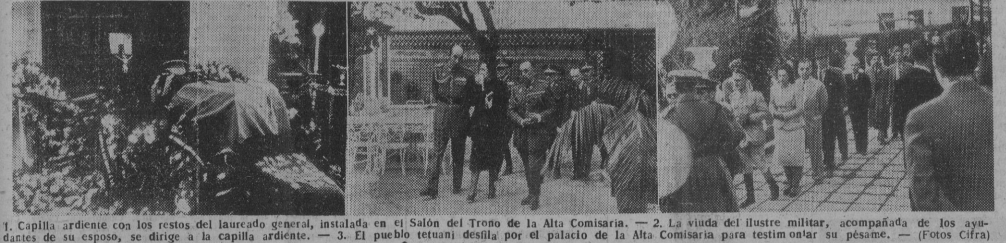
1. Capilla ardiente con los restos del laureado general, instalada en el salón del Trono de la Alta Comisaría. — 2. La viuda del ilustre militar, acompañada de los ayudantes de su esposo, se dirige a la capilla ardiente. — 3. El pueblo tetuani desfila por el palacio de la Alta Comisaría para testificar su pesar.

WASHINGTON, 27. — El presidente Truman ha inaugurado la Conferencia de ministros de Asuntos Exteriores de las 21 Repúblicas de la Organización de Estados Americanos, que se celebra en el Constitution Hall, el mayor salón de esta ciudad, para organizar la seguridad del hemisferio occidental frente a los ataques y amenazas del comunismo a otros países. Durante el segundo conflicto mundial hubo tres Conferencias análogas de la Unión Panamericana, antecesora de la citada Organización, en la que figuraron todas las naciones del nuevo Continente, con la excepción del Canadá.