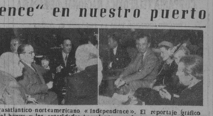
Ayer recalcó en nuestro puerto el trasatlántico norteamericano "Independence". El reportaje gráfico recoge el momento de la entrada del buque y las autoridades barcelonesas y el consúl de los Estados Unidos durante la recepción celebrada a bordo del mismo.