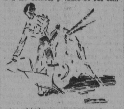
«Litrí», en un natural (Apuntes del natural por R. Segura).

En todo momento Luis Miguel fué el maestro, el torero excepcional, garantía de seguridad en la lidia, atento a los deslices y fallos de sus compañeros.