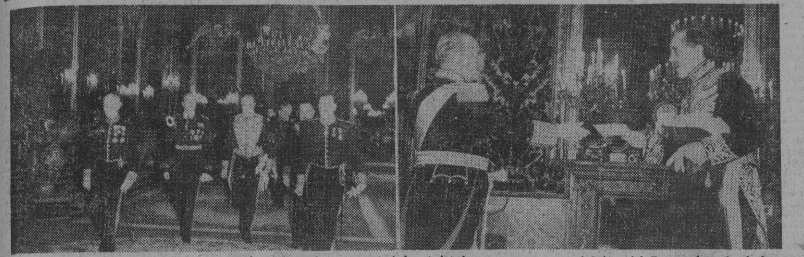
Dos momentos de la presentación de credenciales del nuevo embajador británico: a su paso por el Salón del Trono, después de la ceremonia y en el acto de la presentación de sus credenciales al Jefe del Estado.