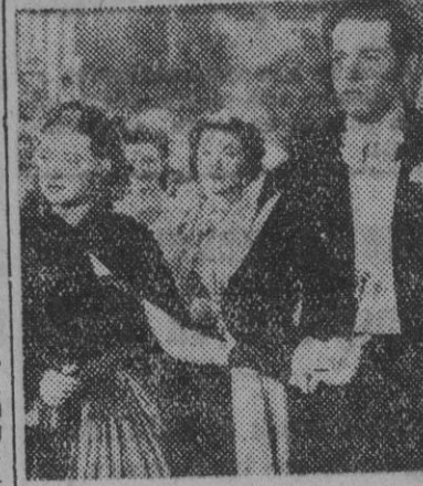
Bette Davis y Henry Fonda, en una escena de la extraordinaria película de William Wyler, «Jezebel»...

RECUERDE ESTE TITULO: «SU AMANTE ESPOSA»