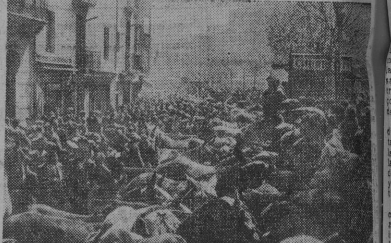
Masa ingente de público... Gran afluencia de ganado... Riqueza y animación del vicense «Mercat del Ram»