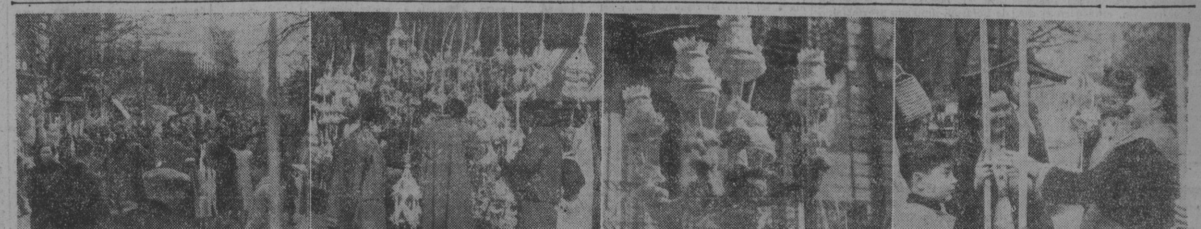
La Rambla de Cataluña presenta en estos días un animado aspecto que la máquina del reportero ha recogido en estas cuatro fotografías. El arte de ornamentación y trenzado de las palmas se muestra magnífico en estas bellas obras, que son la admiración de los que visitan la feria.