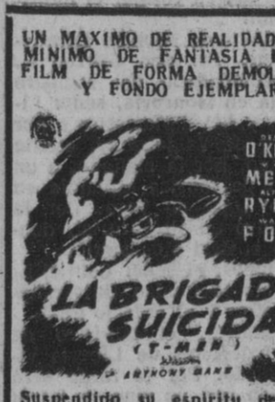
Suspendido su espíritu desde el primer disparo, en hora y media no hallará tregua para su emoción