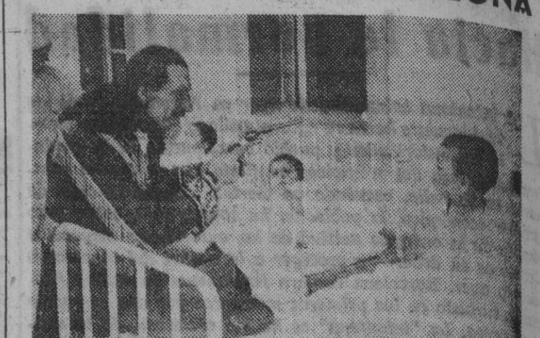
Procedente de Londres ha llegado a nuestra capital el Capitán Gra, Buffalo Bill, quien se presentará al público barcelonés al frente del espectáculo mundial del Circo Americano...