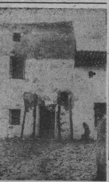
Una casa de Baena resquebrajada a consecuencia del seísmo registrado en casi toda España, y que hubo de ser derrumbada para evitar su derrumbamiento

Baena sufre las consecuencias del terremoto