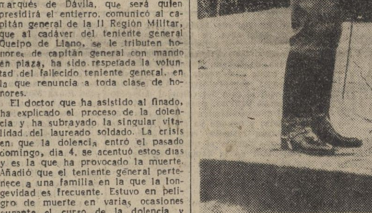
El emocionante momento durante el cual S. E. el Jefe del Estado imponía la Cruz Laureada de San Fernando al heroico defensor de Sevilla. El acto se celebró en la capital andaluza el día 7 de mayo de 1944

Estando en momento de estudio la regulación definitiva de los transportes urbanos de Barcelona, LA PRENSA, deseosa de recoger el mayor número de sugerencias posibles sobre esta cuestión y que el pueblo barcelonés pueda manifestarse sobre la misma, abre una encuesta sobre este problema para la publicación en nuestro diario de aquellos trabajos que tratando objetiva y constructivamente del asunto puedan, realmente, significar una aportación seria a la acertada solución del mismo.