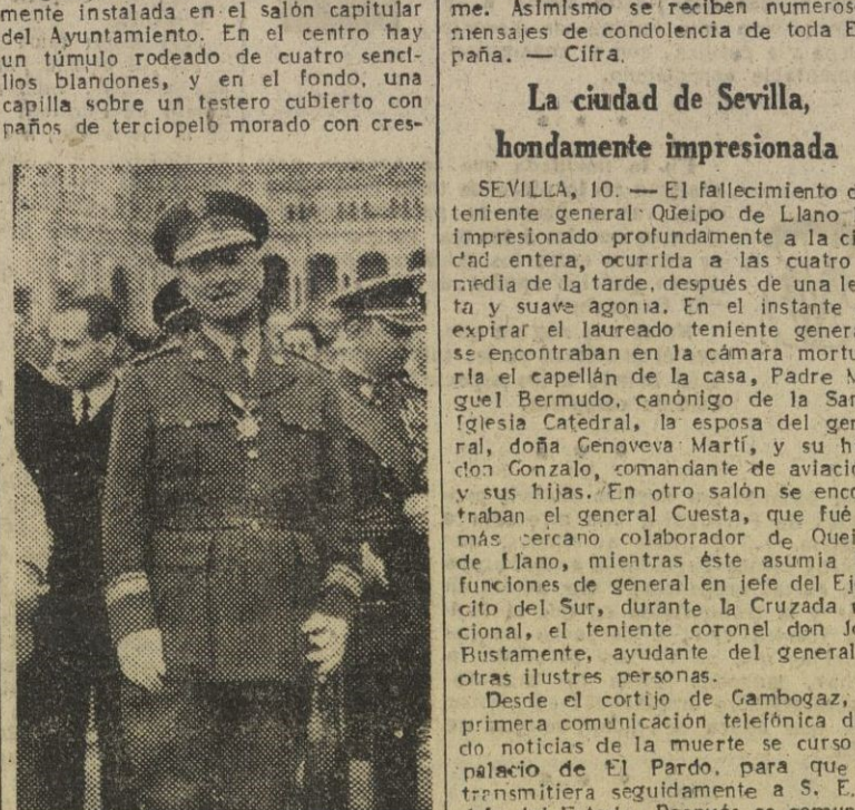
El glorioso general luciendo sobre su pecho la más preciada condecoración del Ejército español

pones negros. En medio hay un crucifijo de regular tamaño y a cada lado, seis cirios en sus candelabros. El cadáver será conducido al Ayuntamiento y seguidamente comenzará el desfile del pueblo y de sus representaciones, para rendir póstumo homenaje a los restos mortales del teniente general Queipo de Llano. El entierro se efectuará esta tarde, como ya se ha dicho, a las cinco y media.