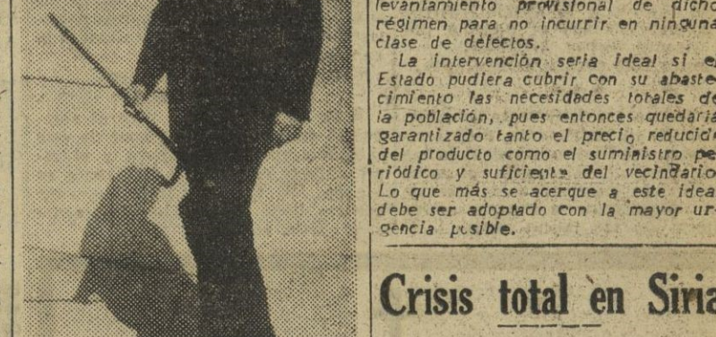
Esta fotografía del general Queipo de Llano fue tomada en nuestra ciudad durante la visita que hizo a la misma el día 13 de marzo de 1944

SEVILLA, 10. — El entierro del teniente general Queipo de Llano será extremadamente sencillo. La viuda del ilustre finado quiere así cumplir la voluntad testamentaria de su es-