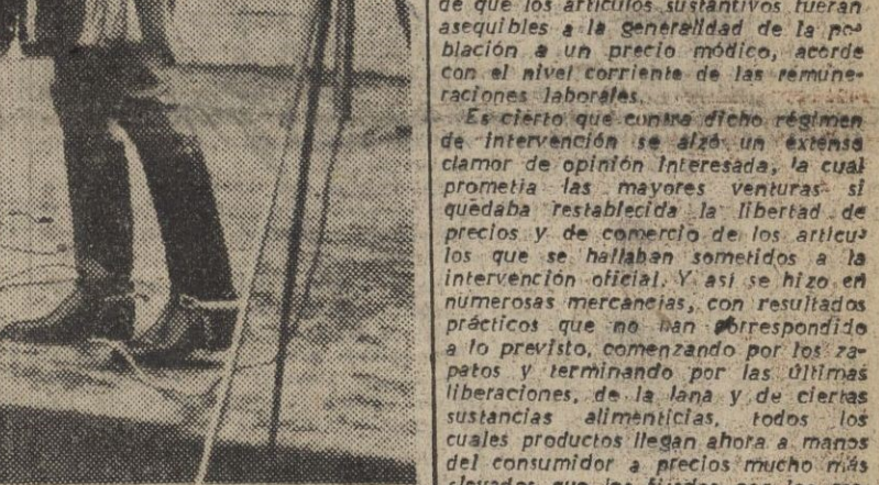
El emocionante momento durante el cual S. E. el Jefe del Estado imponía la Cruz Laureada de San Fernando al heroico defensor de Sevilla. El acto se celebró en la capital andaluza el día 7 de mayo de 1944

SEVILLA, 10. — El Caudillo, al tener noticia del fallecimiento del teniente general Queipo de Llano, llan-