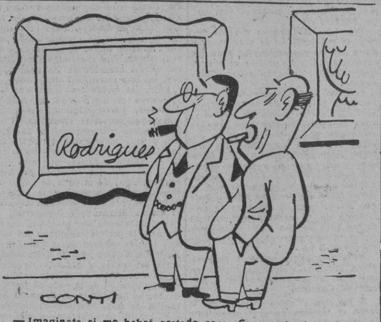
— ¡Imagínate si me habrá costado cara. Es un tela de Rodríguez.