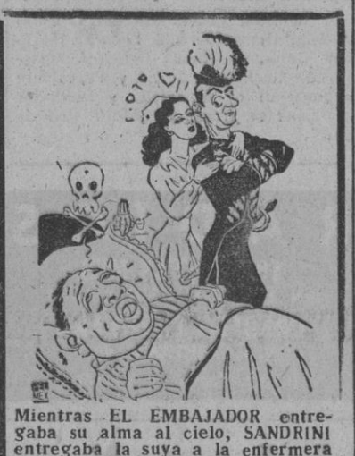
Mientras EL EMBAJADOR entregaba su alma al cielo, SANDRINI entregaba la suya a la enfermera LUNES PROXIMO, CINE PELAYO