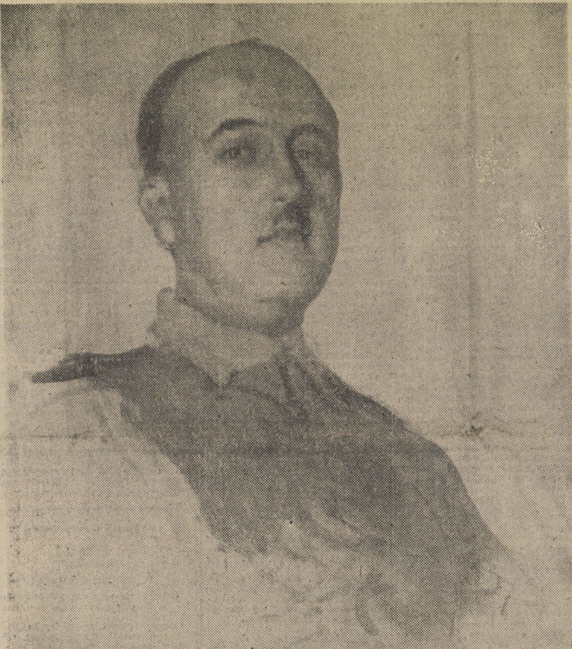
S. E. el jefe del Estado español y Generalísimo de sus Ejércitos, bajo cuya gloriosa Capitanía celebra hoy nuestra ciudad la jubilosa e histórica fecha del XII aniversario de su Liberación

Cada miembro de la O. N. U. debe adoptar su propia decisión en esta cuestión. Por mi parte, creo que se debe llamar al agresor por su nombre. La cuestión relativa a qué se debe hacer sobre la agresión en Corea es, por supuesto, una cosa que se ha de discutir con todas las naciones amigas. No es naturalmente este, el momento de precipitarse o hacer una cosa inoportuna; es momento de pensar claramente y con firmeza. Quiero subrayar de nuevo que la resolución norteamericana contiene, como todas nuestras propuestas han contenido, un método para conseguir el «alto el fuego» y abrir el camino para un arreglo pacífico de las cuestiones pendientes.» — Efe.