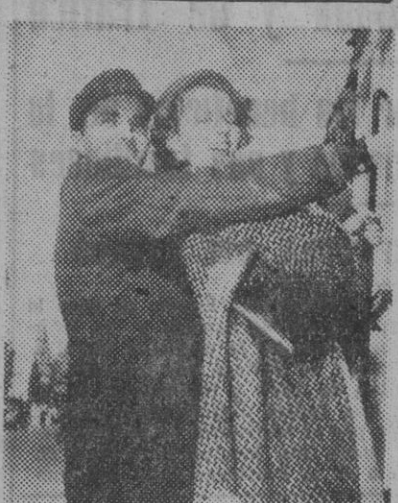
Montgomery Clift y Cornell Borchers, en una escena de "Sitios", película Fox, que el lunes será estrenada en los cines Capitol y Metropol.