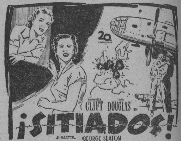
Entre la angustia de la aventura, la intriga del espionaje y la picaresca del mercado negro, una traza de buen humor y la alegre sonrisa de una mujer bonita.