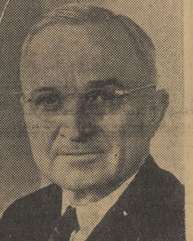
El nuevo presidente de los Estados Unidos, Dwight D. Eisenhower.

Durante cinco años hemos estado trabajando para la paz y por la justicia entre las naciones. Hemos tratado de unir a las naciones libres del mundo en un gran movimiento para establecer una paz duradera. Contra este movimiento por la paz los gobernantes de la Unión Soviética han estado lanzando continuos ataques. Han tratado de socavar a las naciones libres una por una. Han empleado amenazas y traiciones y violencias. En junio, las fuerzas del imperialismo comunista lanzaron una guerra abierta en Corea. Las Naciones Unidas se desplazaron para contener este acto de agresión y en octubre todo había casi triunfado. Luego, en noviembre, los comunistas se lanzaron a la guerra general para conseguir lo que deseaban. Este es el sentido real de los acontecimientos. El futuro de la civilización depende de lo que hagamos ahora y en los meses venideros. Tenemos fuerza y tenemos valor para vencer, el peligro que amenaza a nuestro país. Tenemos que actuar tranquila, sabía y resueltamente. He aquí las cosas que haremos: PRIMERO: Continuaremos manteniendo y si es necesario defendiendo con las armas, los principios de las Naciones Unidas, los principios de libertad y de justicia. SEGUNDO: Continuaremos trabajando con las demás naciones libres para fortalecer nuestras defensas combinadas. TERCERO: Construiremos nuestro propio Ejército, Marina y Aviación y haremos más armas para nosotros y para nuestros aliados.