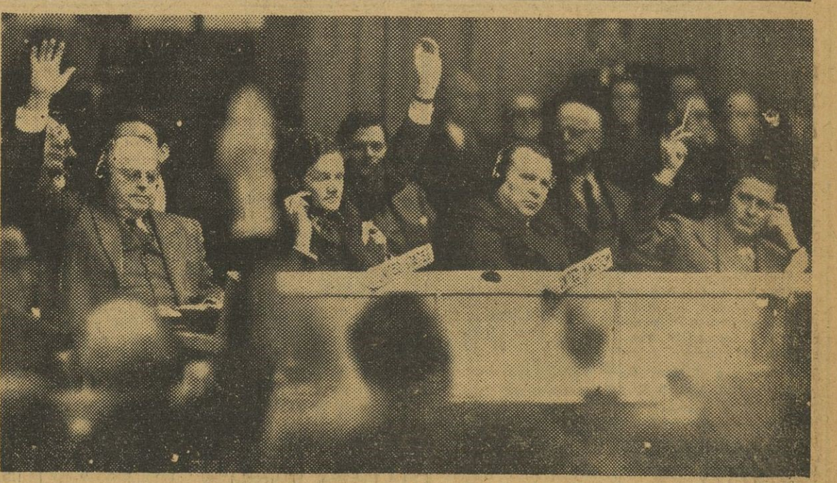
Las Naciones Unidas votan el "¡Alto el fuego!" en Corea, con la única ausencia de Rusia. Malik, en el centro, en estado de expectativa, está preparando los ataques de que poco después hará blanco al norteamericano Warren Austin, que aparece a su izquierda.

Europa y el Mundo, en peligro Existe una guerra real en Extremo Oriente, pero Europa y el resto del mundo también están en gran peligro. La misma amenaza — la amenaza de la agresión comunista — amenaza a Europa así como a Asia. Para combatir esta amenaza, otras naciones libres ne-