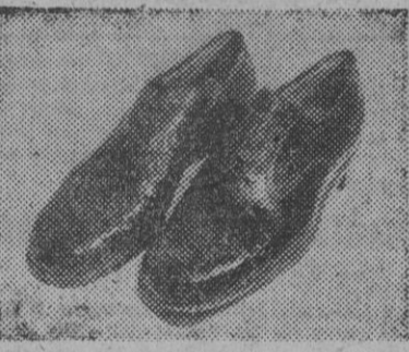
Estos son los zapatos de Artesanía de 800 pesetas de Durany, manufactura de calzados de lujo. Rambla de las Flores, 24

Usted puede ser el favorecido con estos tres regalos más: la pluma "Parker", de la Casa de la Estilográfica, de Fontanella, 19, y una caja de botellas surtidas de Coñac 103 y Manzanilla, de la casa Bobadilla de Jerez