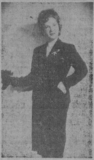
Modelo traje de chaqueta negro, para señora, valorado en 1.000 pesetas, ofrecido por la casa de modas "Mujer". Rambla de Capuchinos, 33, que posee un extenso surtido en vestidos "sport", trajes de chaqueta, noche y abrigos