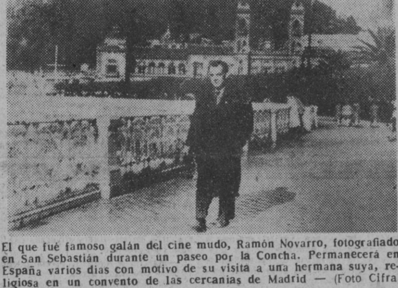
El que fué famoso galán del cine mudo, Ramón Novarro, fotografiado en San Sebastián durante un paseo por la Concha. Permanecerá en España varios días con motivo de su visita a una hermana suya, religiosa en un convento de las cercanías de Madrid