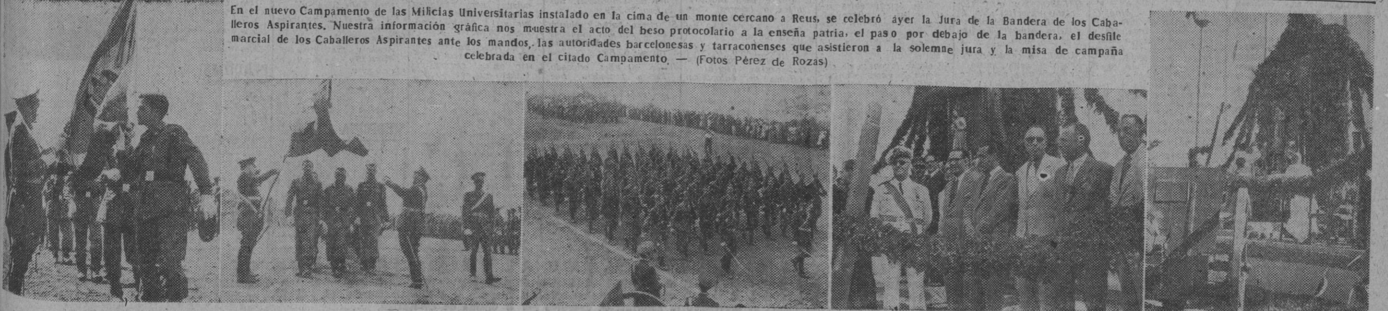
En el nuevo Campamento de las Milicias Universitarias instalado en la cima de un monte cercano a Reus, se celebró ayer la Jura de la Bandera de los Caballeros Aspirantes. Nuestra información gráfica nos muestra el acto del beso protocolario a la enseña patria, el paso por debajo de la bandera, el desfile marcial de los Caballeros Aspirantes ante los mandos, las autoridades barcelonesas y tarraconenses que asistieron a la solemne jura y la misa de campaña celebrada en el citado Campamento.