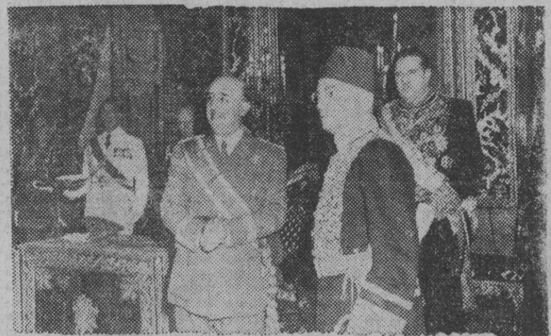
El nuevo embajador de Egipto en Madrid, Mohamed Husni Omar Bey, conversa con S. E. el jefe del Estado en presencia del ministro de Asuntos Exteriores, durante el acto de la presentación de sus Cartas Credenciales, celebrado en el Palacio de Oriente.