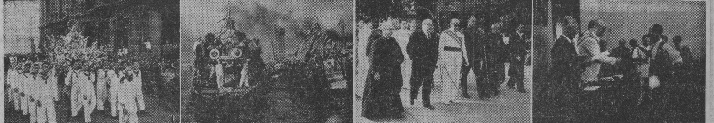
Marineros de la Armada trasladan a hombros la imagen de Nuestra Señora del Carmen, hasta el puerto, donde se organizó la tradicional procesión marítima, cuyo brillante aspecto recoge la segunda de nuestras fotos. En la tercera, las autoridades presidiendo el solemne cortejo religioso a su paso por nuestras calles. La cuarta muestra un momento del reparto de premios celebrado en el Posito de Pescadores.