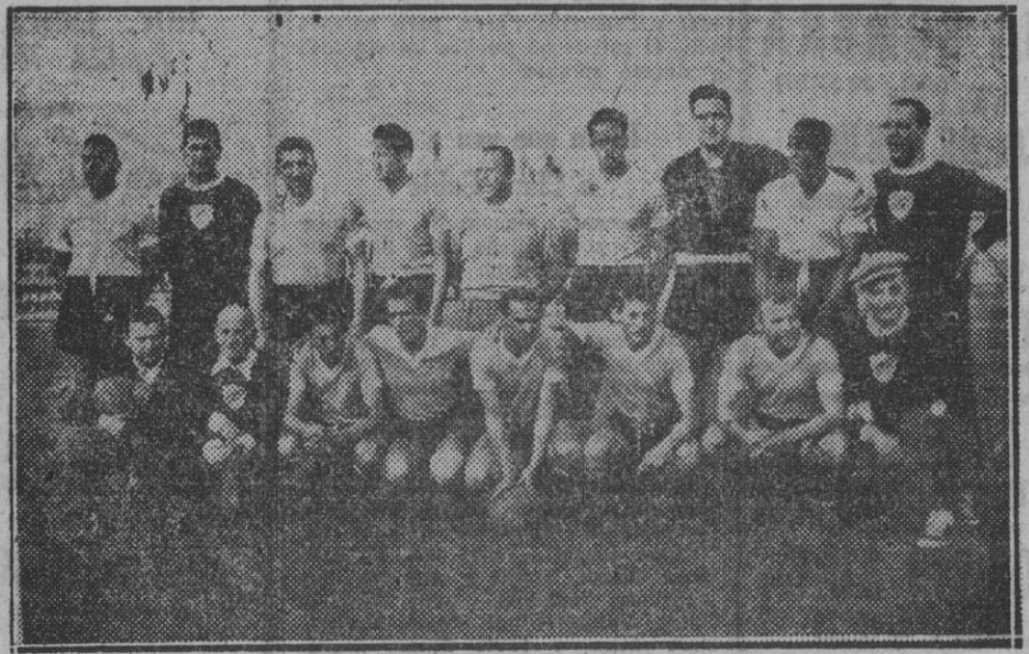
La selección del Uruguay, que ayer ganó el Campeonato del Mundo de Fútbol