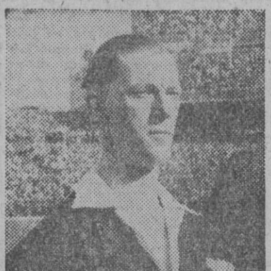
Este es Mr. Leafe, el excelente árbitro inglés, que ya dirigió el encuentro España-Portugal en Chamartín, eliminatorio para la Copa del Mundo, será el encargado de juzgar la contienda de esta tarde, en Maracanã, entre los españoles y brasileños. El partido es decisivo para la Copa Mundial.

"Saldremos a ganar", dice Gainza RIO DE JANEIRO, 13. (Añil.) — "Saldremos al campo a ganar", ha declarado Gainza, capitán del equipo español, minutos antes de comenzar el partido con Brasil, en el Estadio de Maracanã.