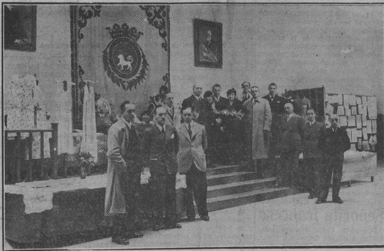
Autoridades y profesores que inauguraron ayer los trabajos expuestos con motivo de fin de curso

Ayer a mediodía quedó inaugurada en la Escuela de Artes y Oficios la exposición de los trabajos realizados por los alumnos durante el curso de 1935-treinta y seis.