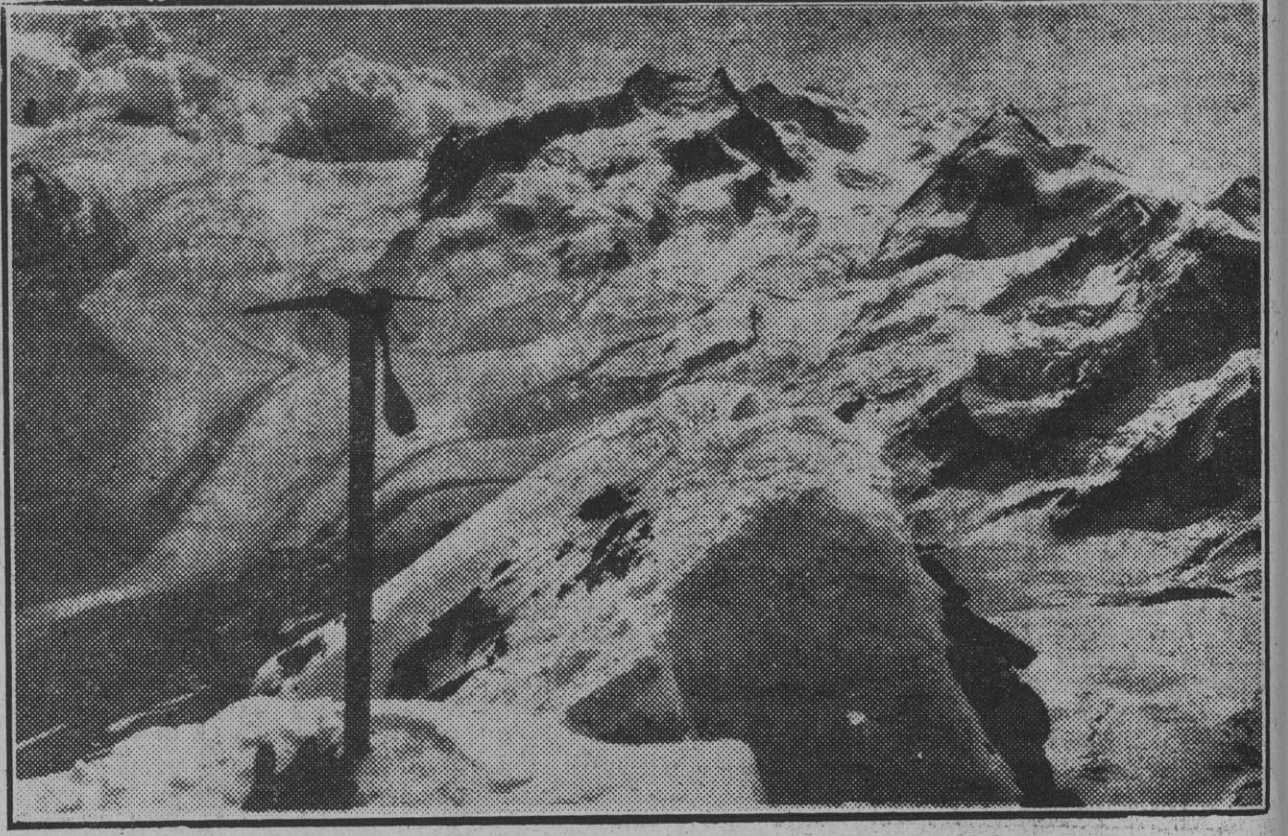
El monte Rosa (el segundo coloso de Europa), con sus Nord Dent y Punta Deufour (4.638 m.) al E.