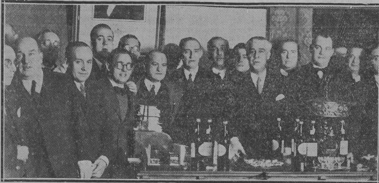
El gobernador civil, don Emilio de Sola, con los funcionarios del gobierno y algunos de los amigos que por suscripción le han regalado un bastón de mando.

GOBIERNO CIVIL El señor de Sola recibe un obsequio de sus amigos Y pone en libertad a los presos gubernativos