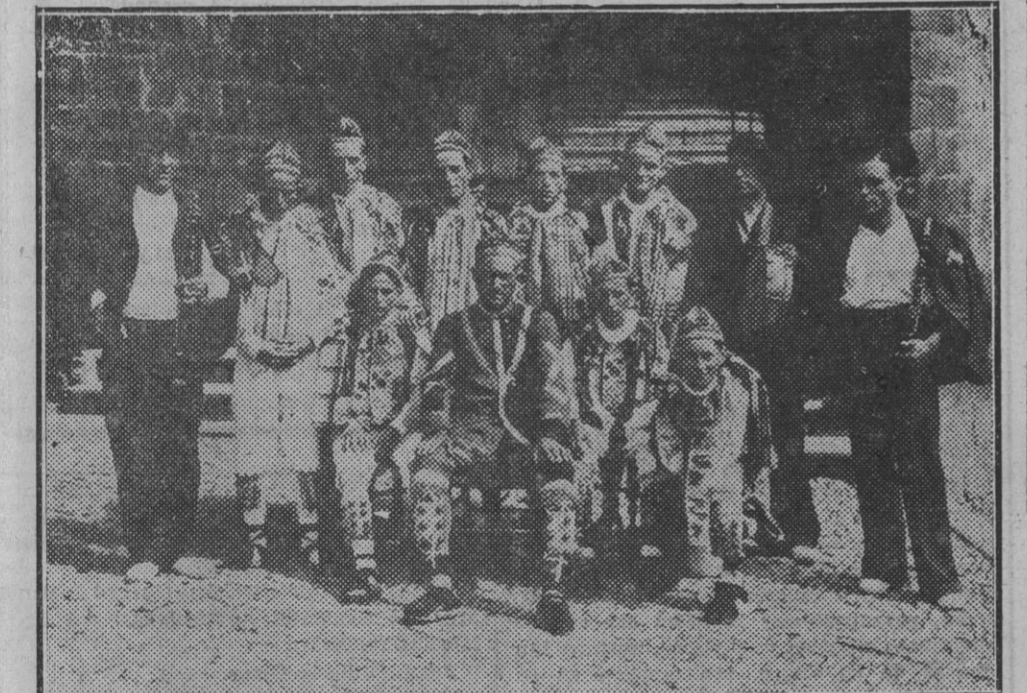
DE OCHAGABIA.—Los famosos danzaris och agarras, que han animado las fiestas de la hermosa villa salacense.

Clases selectas. Aroma concentrado TUESTE DIARIO Paulino Caballero, 13. Teléfono 2679