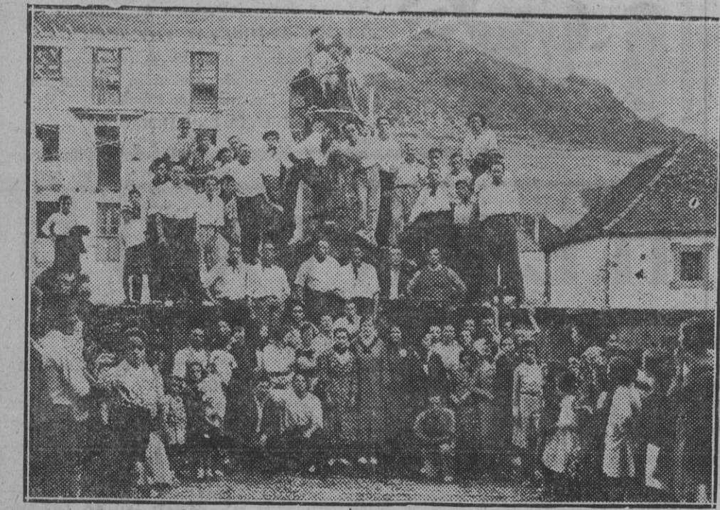
DE OCHAGABIA.-Bellas muchachas y azkarros mufles ochagitaras posando para LA VOZ en uno de los días de fiestas