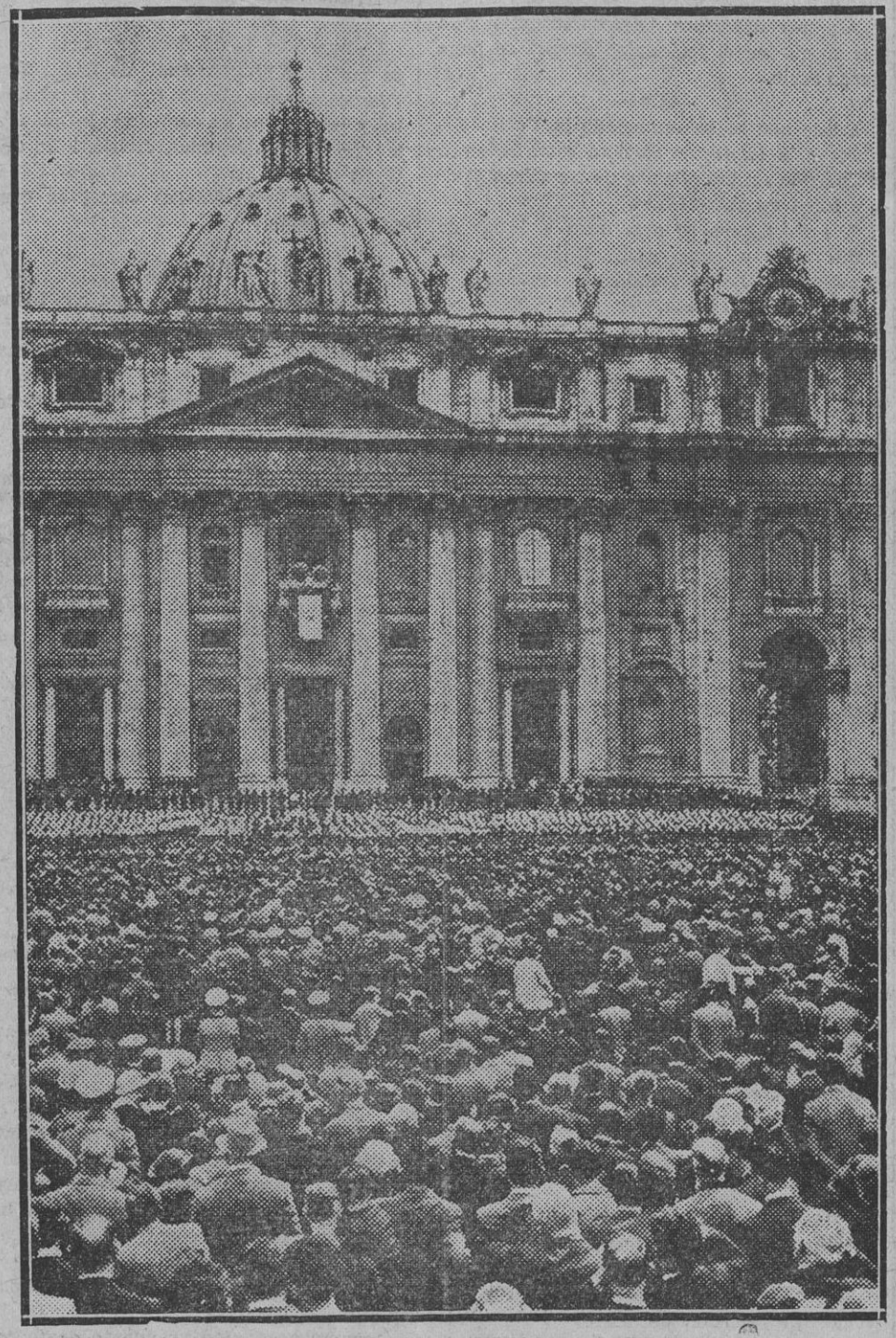
Las solemnidades religiosas con que se ha celebrado este año la festividad de la Pascua en Roma, exceden a toda ponderación. A cincuenta mil asistentes los fieles que oyeron la Santa Misa dentro de San Pedro: muchos miles tuvieron que quedar en la gran plaza. Al salir el Santo Padre al balcón central para dar su bendición urbi et orbi, fué recibido con clamorosas e inenarrables ovaciones y aclamaciones. De la concurrencia enorme que llenaba la magnífica plaza, da una ligera idea, la foto que publicamos.

En la comisaría fueron reconocidos por unos señores que en la tarde de ayer fueron atacados en el monte Ulía.