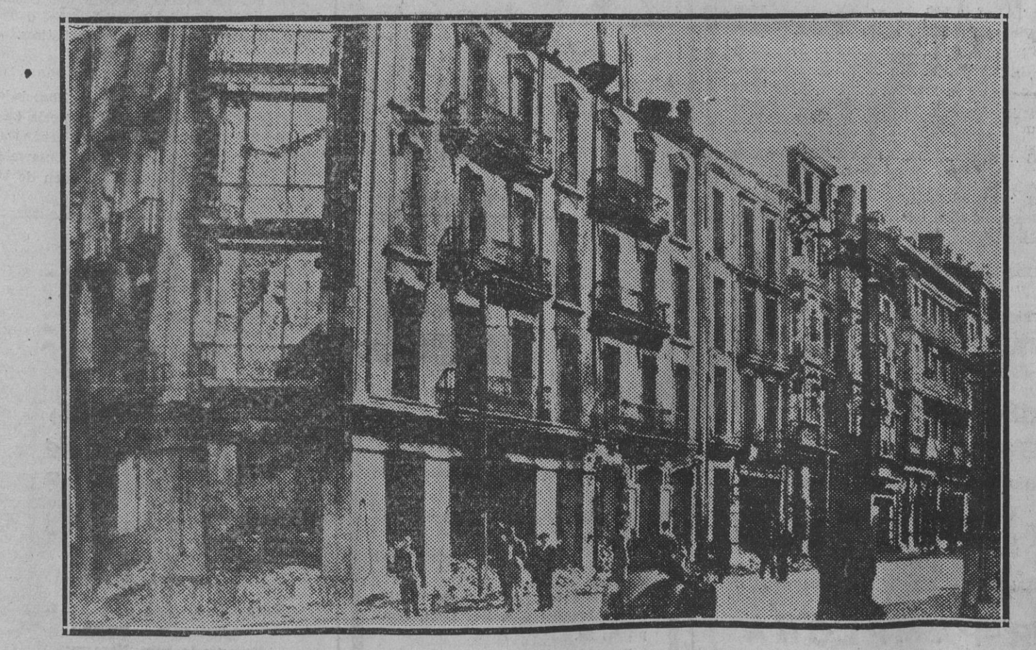
OVIEDO :— Manzana de casas de la Calle Fruela incendiada o destruida a dinamizos por los socialistas asturianos