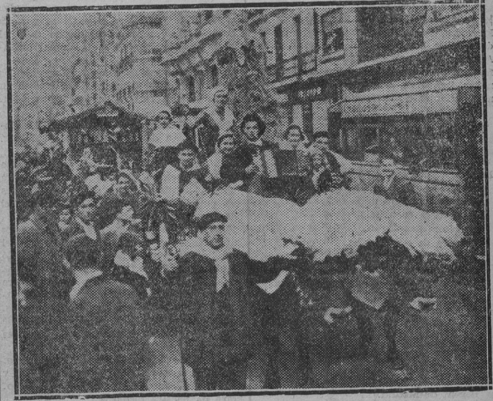
Unas de las carrozas que más agradaron en el desfile organizado en San Sebastián por las sociedades de carácter popular con motivo de las fiestas de Pascuas

U M E T X U S Pronto apertura del nuevo local