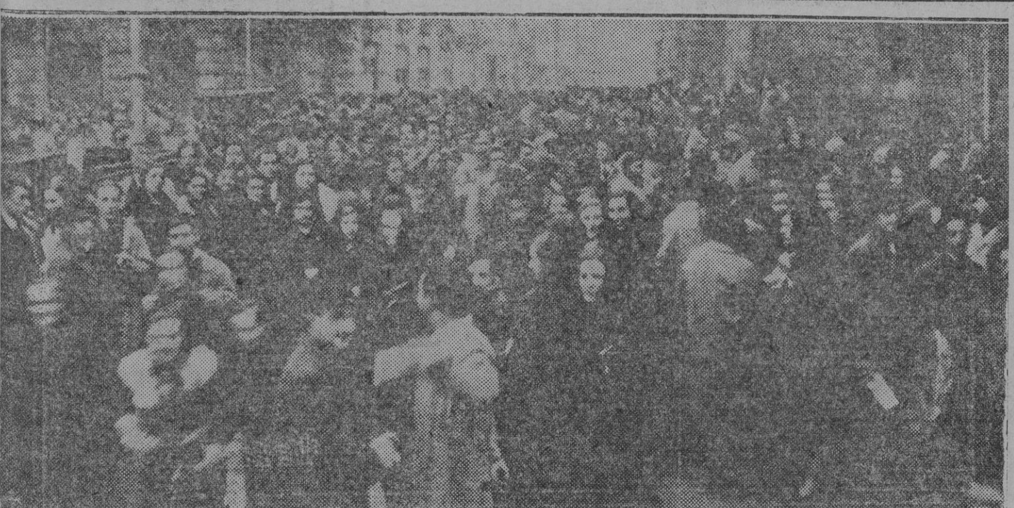
Patriotas bilbaínos saliendo de los funerales celebrados por el alma de Sabino Arana, el Fundador y Maestro del Nacionalismo Vasco.