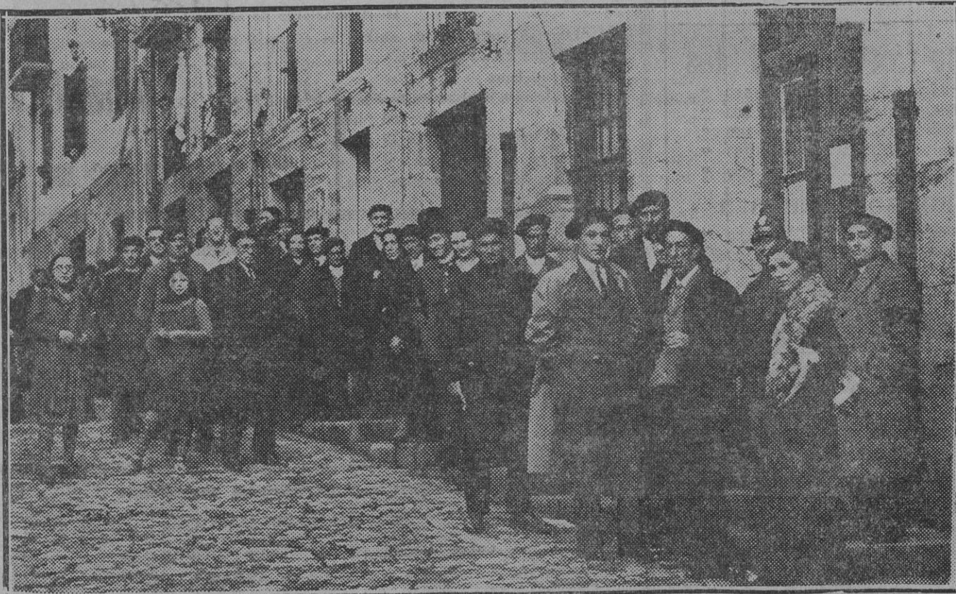
EL CIVISMO DEL DOMINGO :: Pamploneses que se alineaban para las nueve y media hacia la puerta del Colegio de la Inclusa