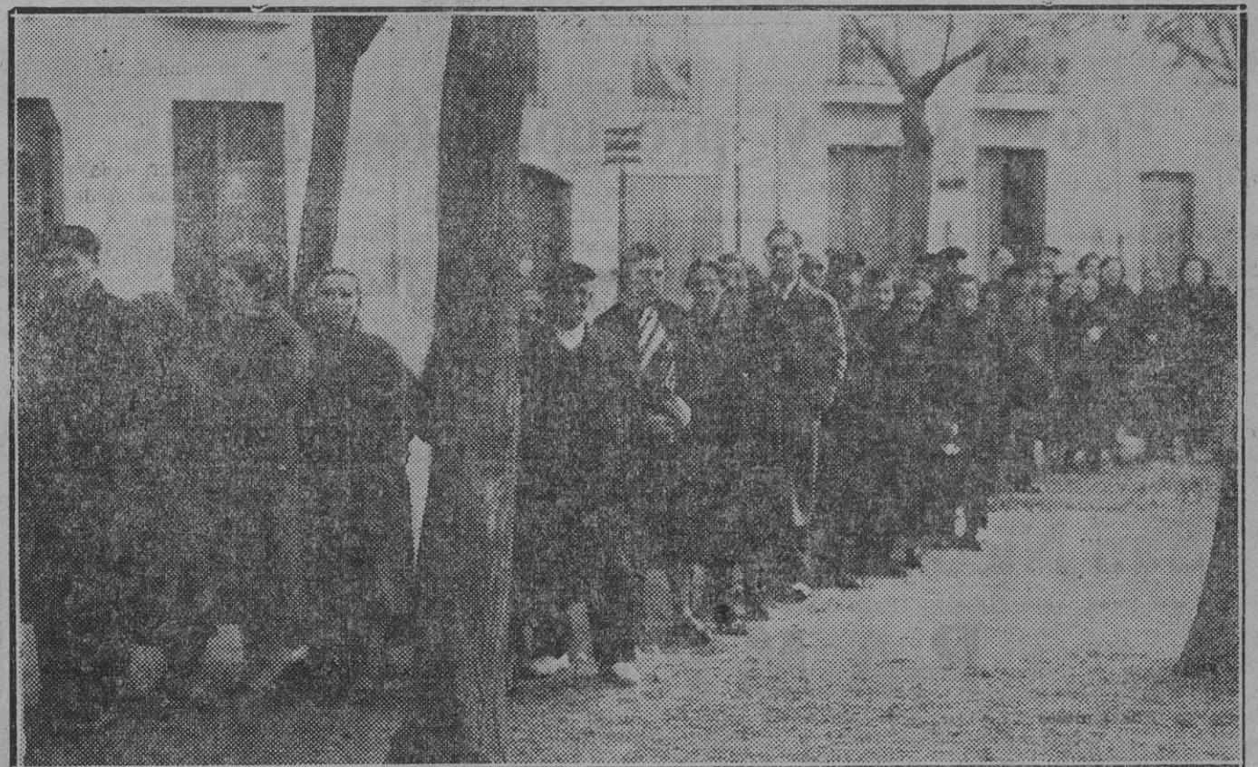
ESTAMPAS DEL DOMINGO :: Las mujeres madrugadoras... como siempre, formando cola para votar a las ocho y cuarto en el Colegio de las Escuelas de San Francisco