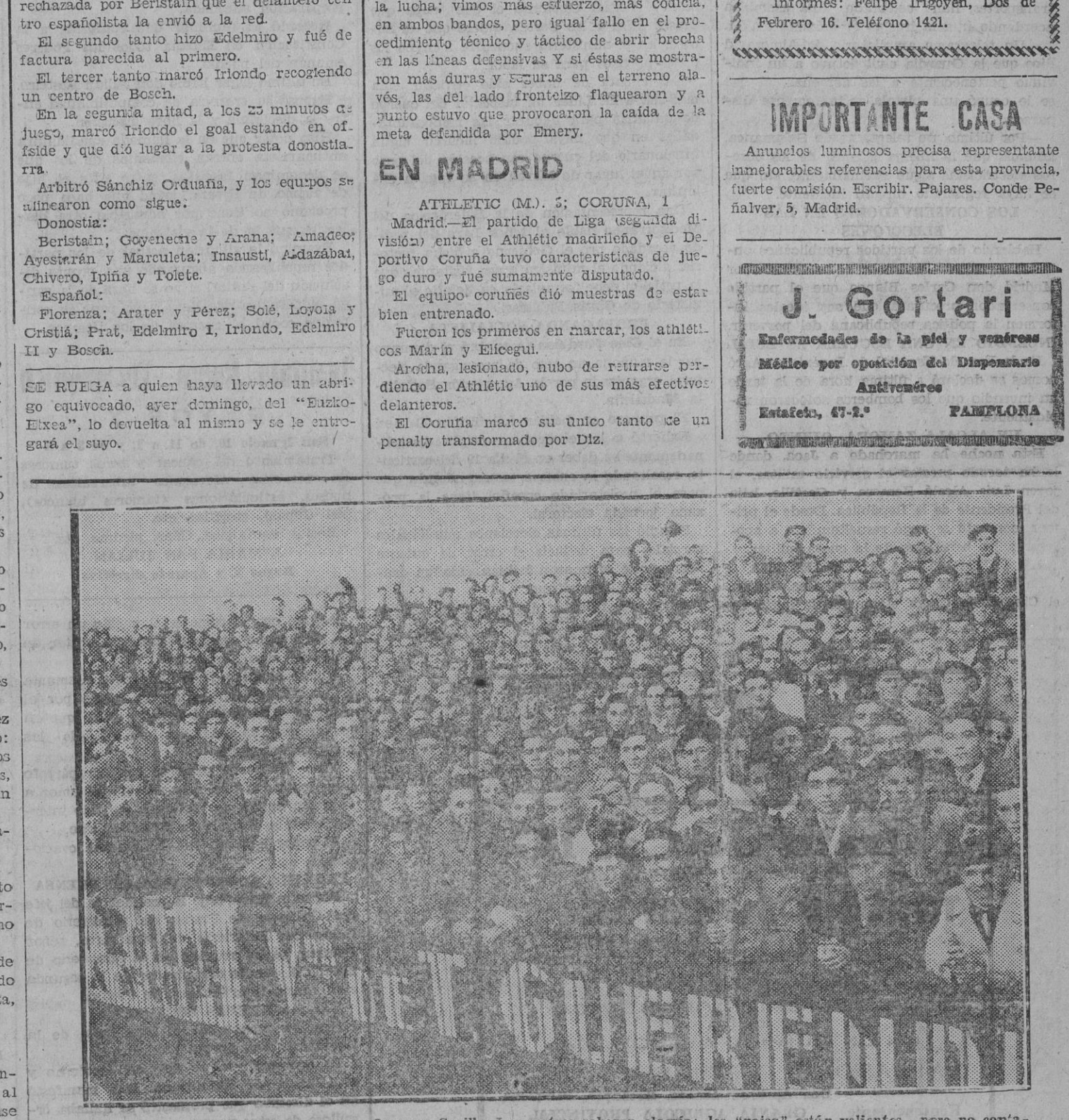
Aspecto "de lo general" durante el partido Osasuna-Sevilla. Los rojos rebosan alegría; los "rojos" están valientes... pero no contaban con la "huespeda"