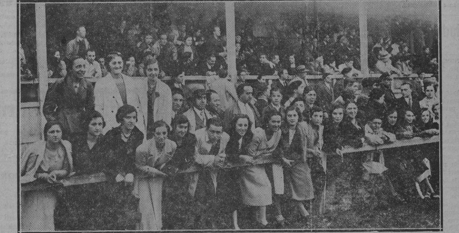
Público de preferencia y gradas en el partido Ocasuna Zaragoza.

Mendigoiuales y Juventud Patriota: Acudid a la reunión que el día 14 a las ocho y media de la noche se celebrará en Euzko-Etxea. Por tratarse de asunto importantísimo es necesario acudir todos.