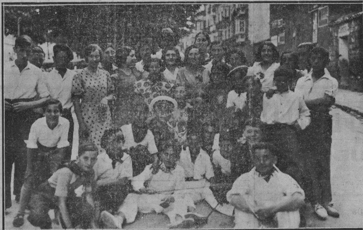
En el ajetre de las fiestas ellas, encantadoras, y ellos, incansables se ofrecen al fotógrafo para perpetuar estos momentos de diversión