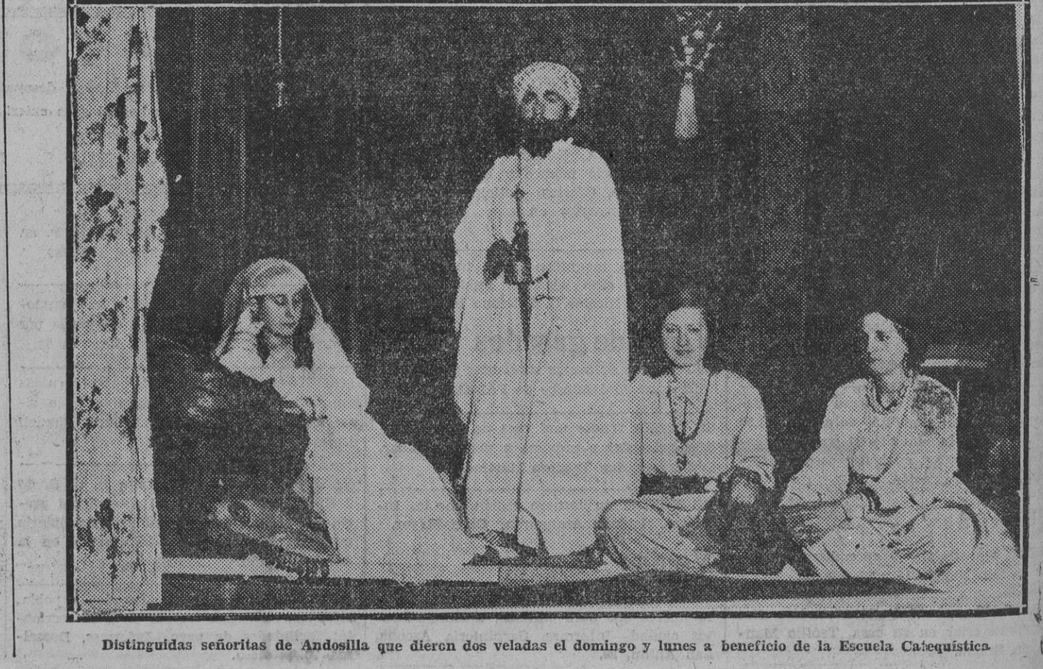
Distinguidas señoritas de Andosilla que dieron dos veladas el domingo y lunes a beneficio de la Escuela Catequística