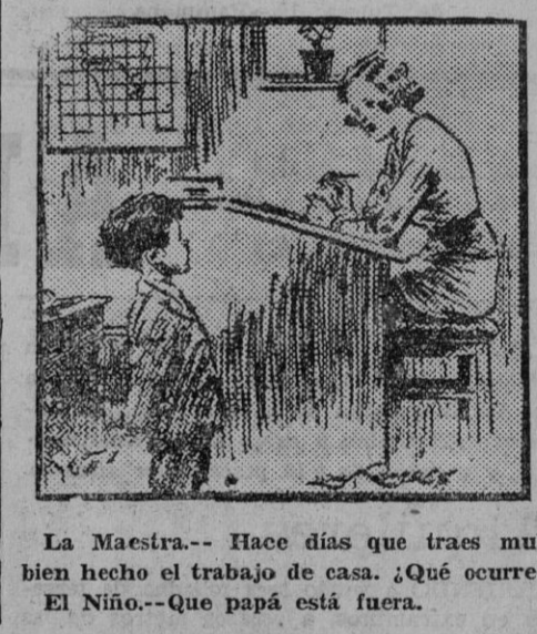
La Maestra.-- Hace días que traves muy bien hecho el trabajo de casa. ¿Qué ocurre? El Niño.-- Que papá está fuera.