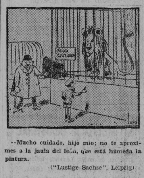
Mucho cuidado, hijo mio; no te aproximes a la jaula del león, que está húmeda la pintura.

DECRETO DE E. B. B. Llegado el día en que este Consejo Supremo del P. N. V. cree deber dar cumplimiento al acuerdo de la Asamblea Nacional abierta en Tolosa el día 4 del pasado diciembre, dicha Asamblea reanudar su labor el próximo domingo, día 29 de enero, en la misma villa y local y hora de las once de la mañana.