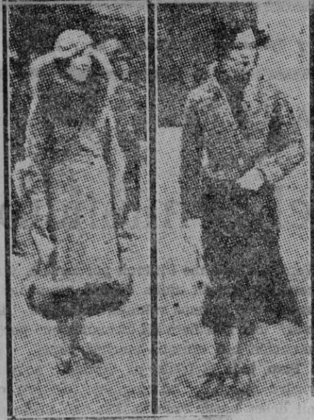
Modelos vistos recientemente en Auteuil