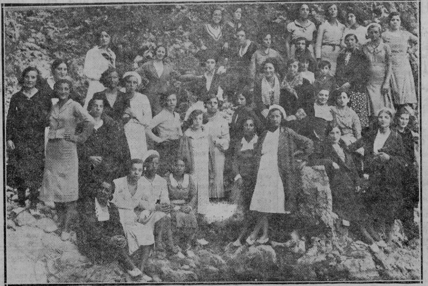
Un bello grupo de obreras del Sindicato Católico, que veranean en Salinas de Oro.

Se nos comunica del Comité de Iniciales, Propaganda y Turismo de Navarra, que tiene el proyecto de organizar en esta Provincia una excursión en autocar a la región gallega, visitando Santiago y otras localidades, tanto de Galicia como de Santander y Asturias. Se trata de un hermosísimo proyecto por el que merecen plácemes sus organizadores. Oportunamente ofreceremos a nuestros lectores detalles de esta interesantísima excursión.