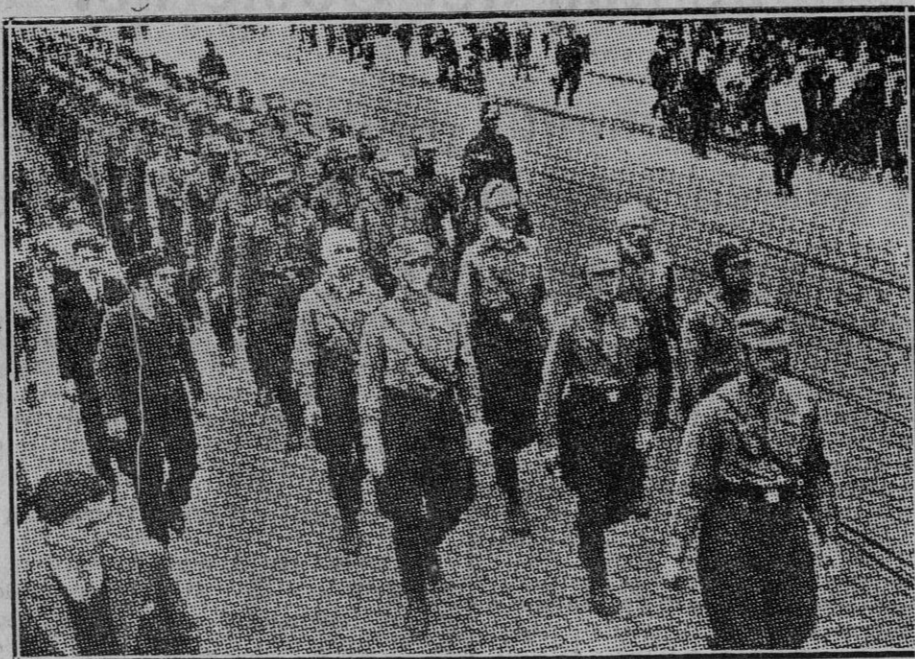
Una marcha de "nazis" después de una febriga en la que han resultado heridos, algunos de los cuales se ven en primer término