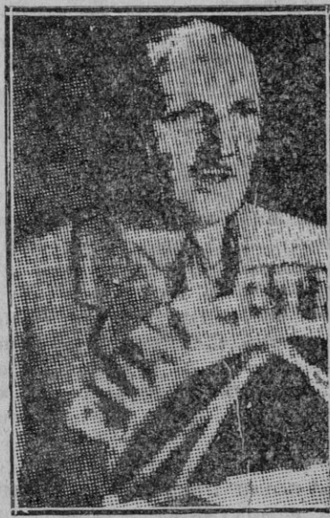
El general Schleider, Ministro de la Guerra alemán, pronunciando el famoso discurso electoral que tanto ha dado que hablar.

Y es el caso que Hitler, en sus propagandas, ha expuesto su desdén por el acuerdo de Lausana que no satisface las reivindicaciones de orden político y territorial que viene reclamando, y porque no es una rectificación total del Tratado de Versalles. Parecida hostilidad muestran por el pacto de Lausana el grupo de Hugerberg y los comunistas. Por tanto es más que posible que sea rechazado por el futuro Parlamento.