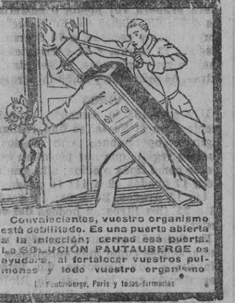
Convenientes, vuestro organismo está debilitado. Es una puerta abierta a la infección; cerrad esa puerta. La SOLUCIÓN PAUTAUBERGE os ayudará, al fortalecer vuestros pulmones y todo vuestro organismo.

En el aserradero de Zubiri, situado al pie de la carretera, puede adquirirse leña de haya y roble en trozos manuable que no exceden de un metro de largo, para panadería e industrias, y también cortada expresamente para cocinas económicas y calefacción, puesta sobre camión en Zubiri, a domicilio o sobre vagón Pamplona. Existe balsa para camiones, donde pesar cómodamente la leña con exactitud. También vendemos leña en iguales condiciones, sobre vagón Olazagutia. Dirigirse a HIJOS DE VICTORIANO ECHAVARRI, OLAZAGUTIA, o a su Administrador, en ZUBIRI