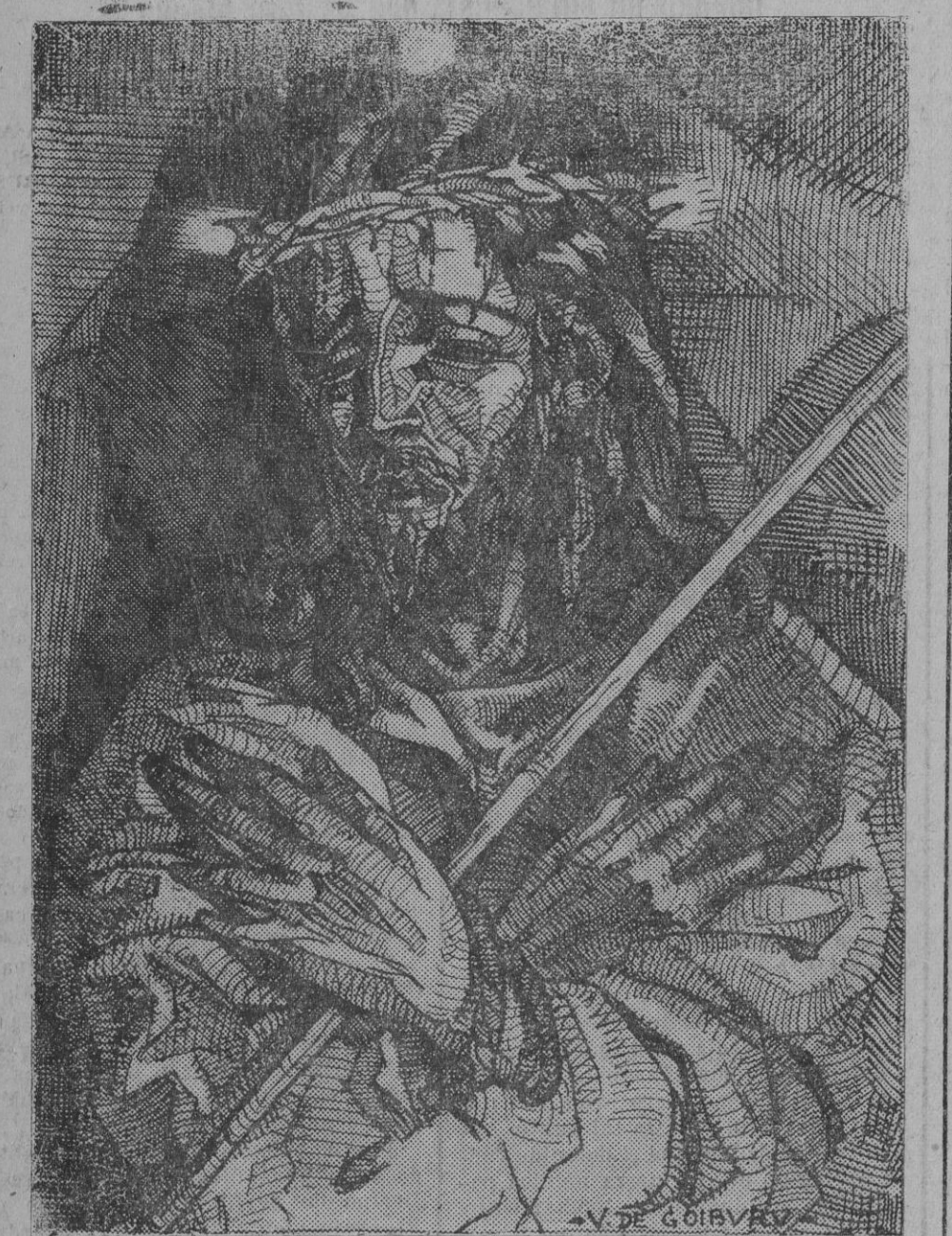
ECCE HOMO, por Valentin de Goiburú