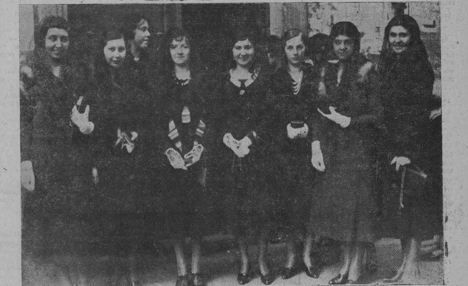
Bellas visitantes de Monumentos, de las que ayer se vieron en abundancia, de casa y de fuera de casa.

La lucha fué desigual, desde el momento que el ganador luchó con dos metros y pico, 120 kilos y 24 años contra 1,75 m., 84 kilos y 33 años que tiene el "durmiente".