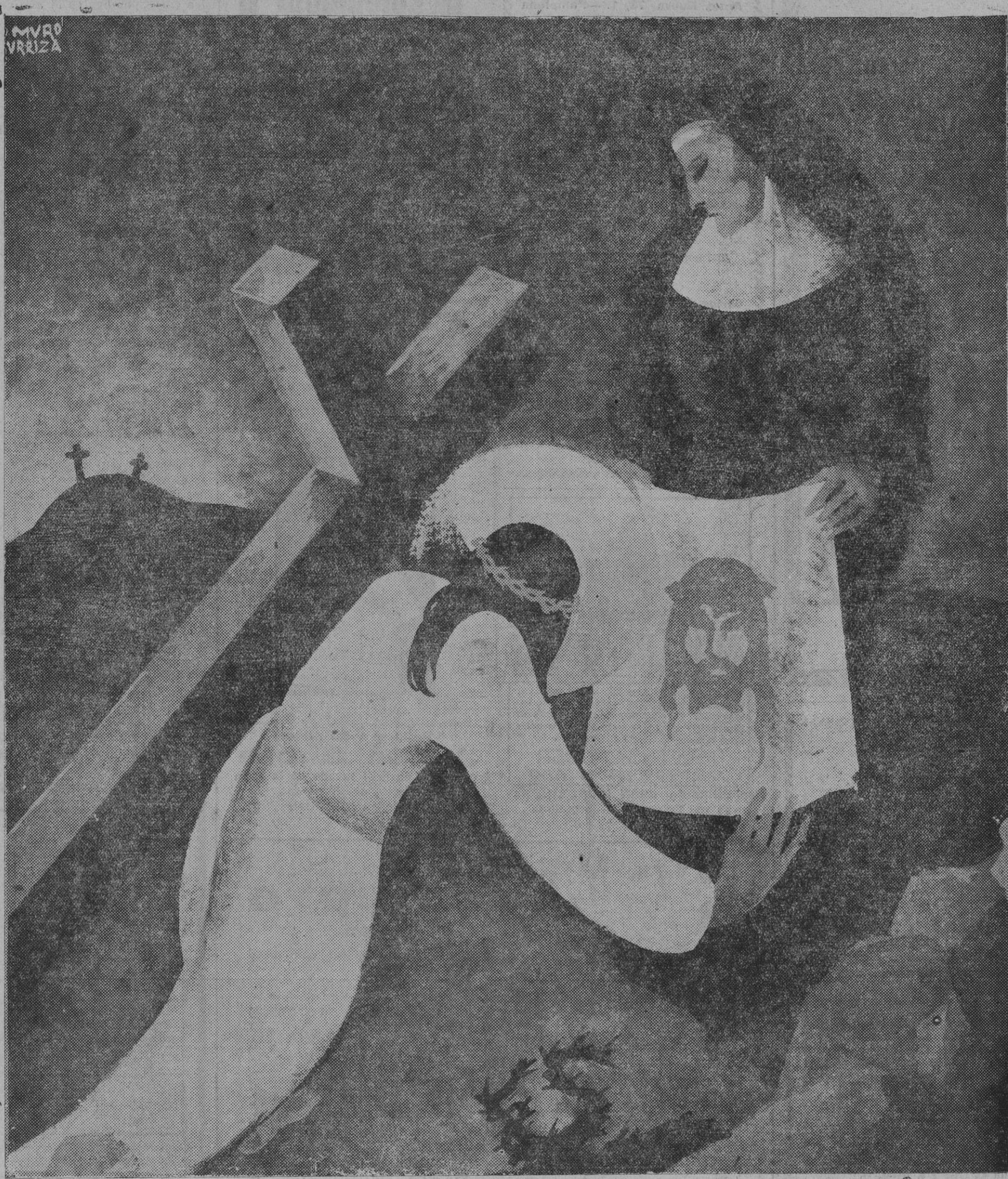
LA VERONICA, por Leocadio Muro

De esta manera, pues, fué quemado el templo contra la voluntad de Tito; pero aunque haya alguno que piense haber sido esta destrucción muy digna de lágrimas y de ser muy llorada, porque la obra era la mejor, más excelente y más maravillosa de cuantas hemos visto u oído, tanto en su edificio, cuanto en su grandeza y magnificencia en cada cosa; y en la gloria y honra que a las cosas santas