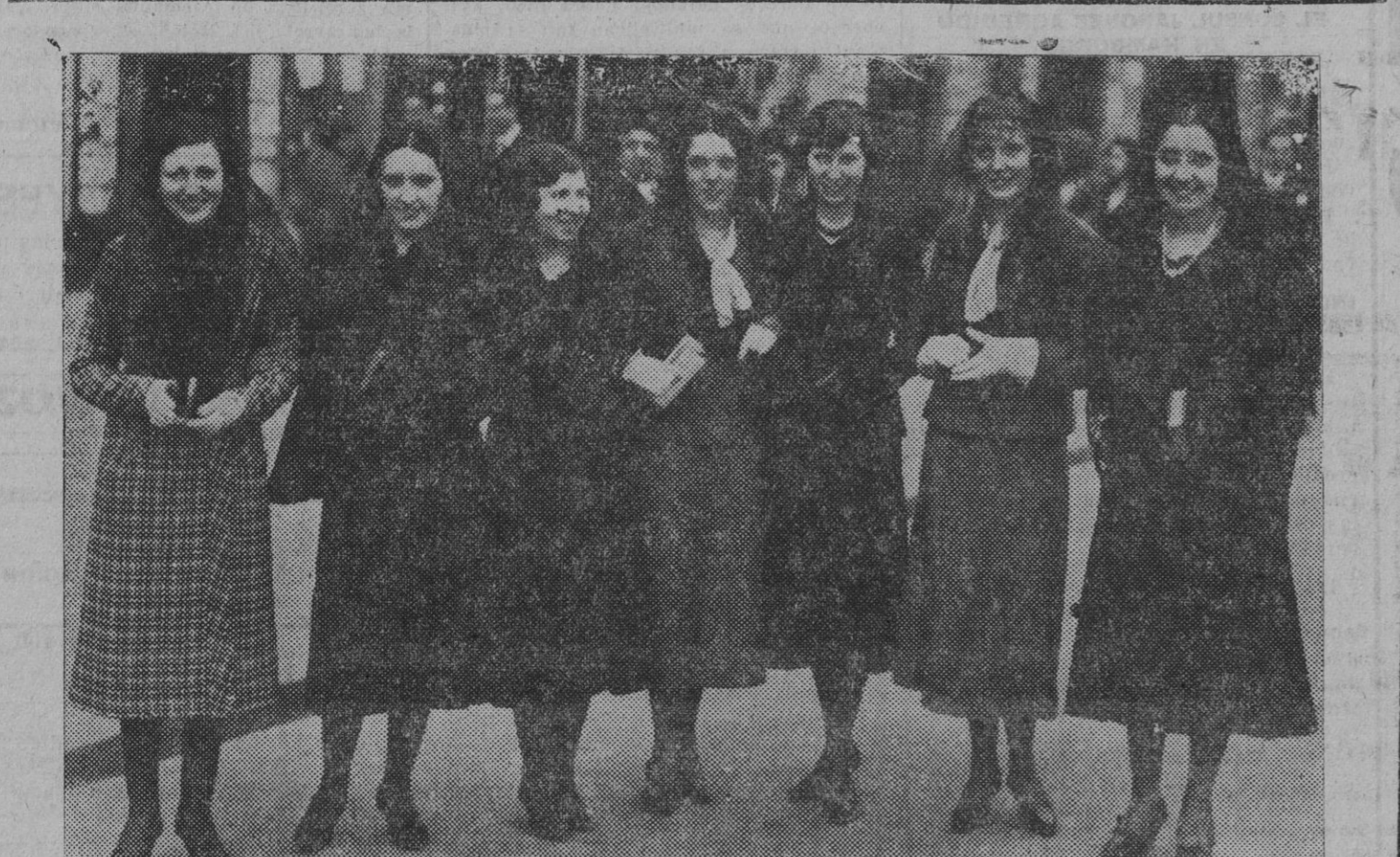
Otro grupo de gentiles pamplonesas, ataviadas al aire de la tierra.