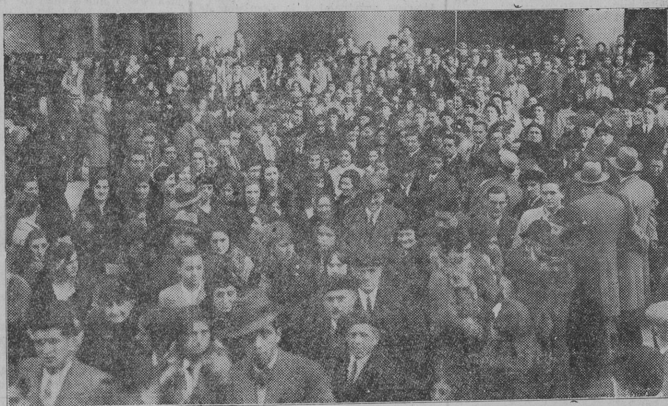
El público saliendo de la Santa Iglesia Catedral después de terminada la ceremonia religiosa celebrada ayer para conmemorar la festividad del día.

Casa Arrillaga RELOJERIA — OPTICA AJARNAUTE, Zapatería 50, Pamplona