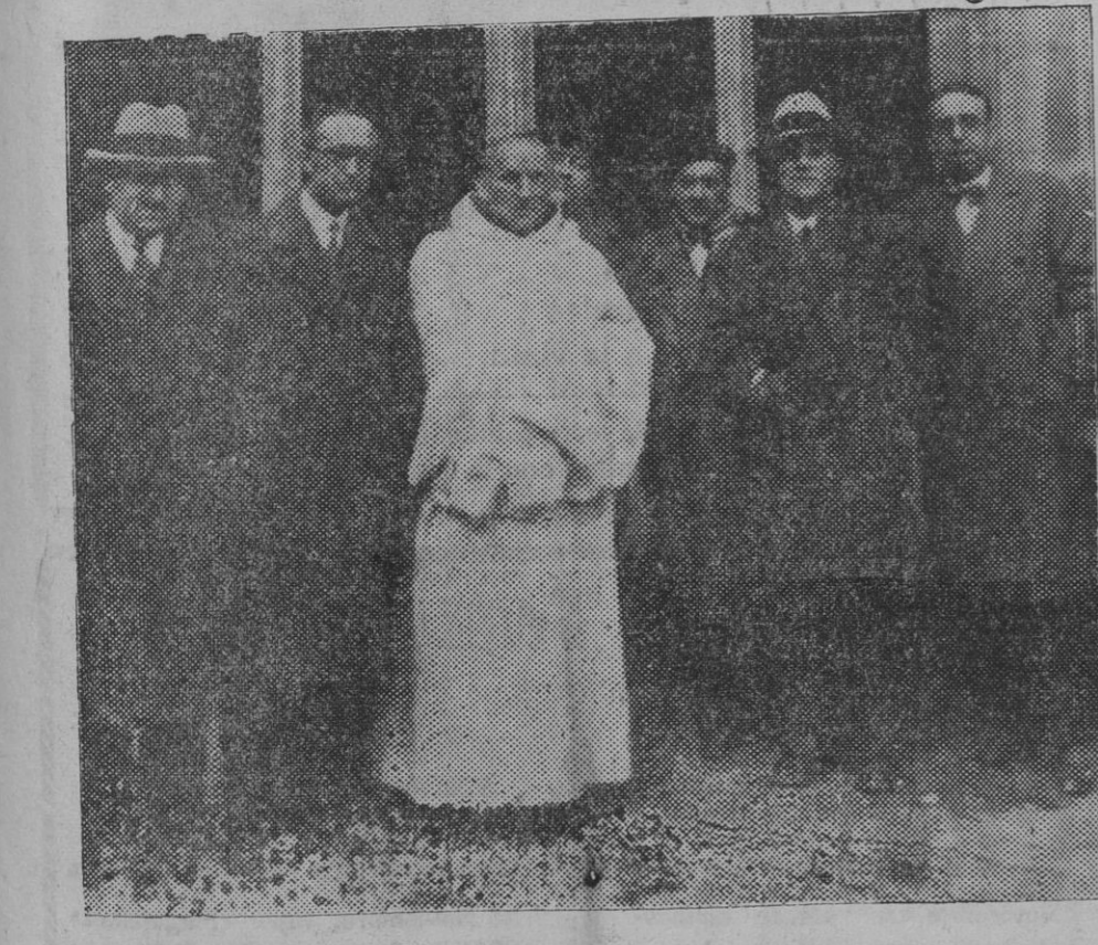
La Comisión de Monumentos de Navarra con el Prior de La Oliva, a donde se trasladaron con motivo de la inauguración de su magnífico templo.