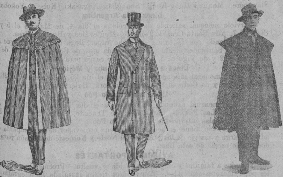
Modelo capa española.