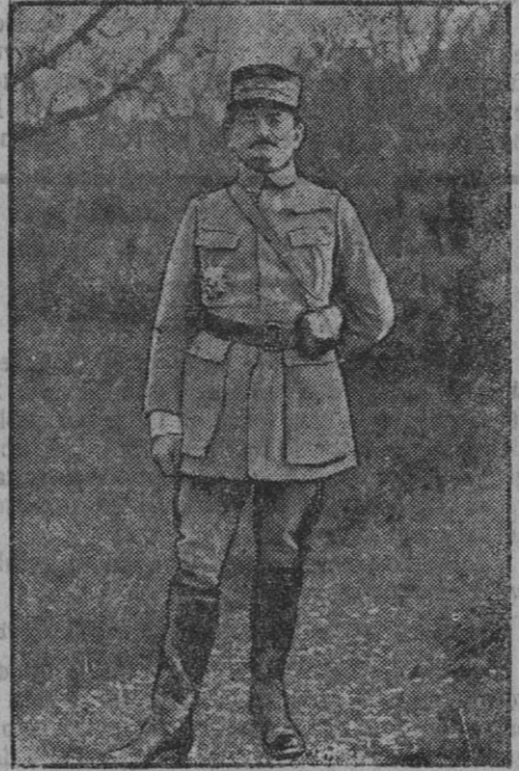
El general Mangin.

Se concede el retiro, por inútil, al sargento de Infantería don Ignacio Jáigo.