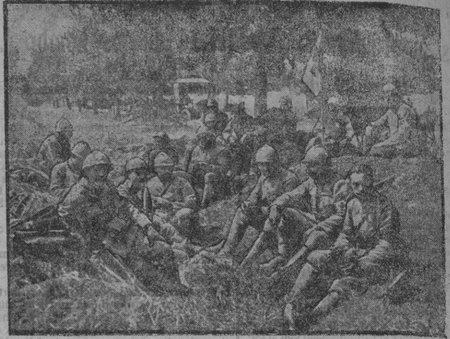
Puesto de socorro francocamericano.

Cuanto se relaciona con la colaboración política, militar y literaria de EJERCITO Y ARMADA, es de la exclusiva competencia del director.