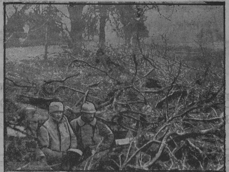
De la guerra.—Puesto avanzado francés.

Esta calma la aprovechará Foch para reforzar las posiciones tomadas y organizar el nuevo plan de defensa o de ataque que haya de realizarse, según las circunstancias.