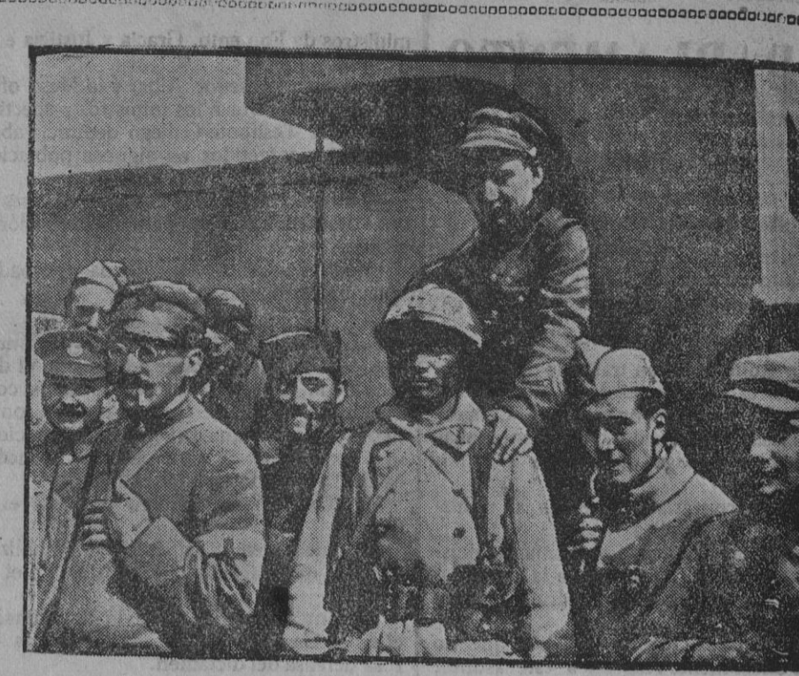
De la guerra.—Soldados aliados.