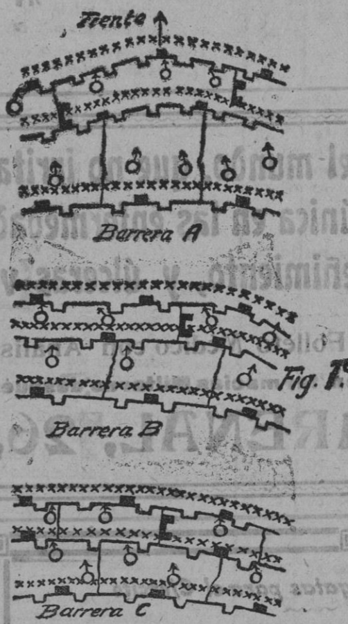
Fig. 1. Barrera A, B, C. Trincheras, Alambradas, Ametralladoras, Abrigos de cemento, Abrigos de combate.

La segunda barrera recibe el nombre de «zona de gran combate» ( Grosskampfszone ); como a la anterior, la forman un sistema de trincheras y de obras escalonadas en profundidad hasta una gran distancia, con abundancia de puntos de apoyo y grupos de abrigo. Las ametralladoras están dispuestas en forma de