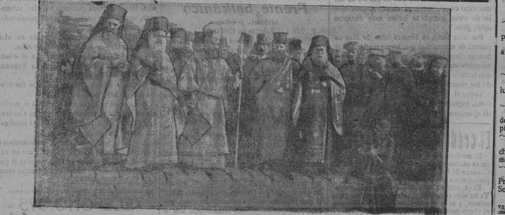
La fiesta de la Epifanía en Grecia.