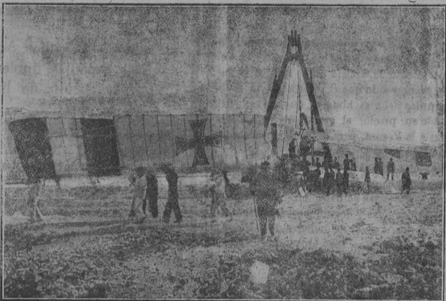
Avión austriaco capturado por los italianos en Ancona.

Así, al empezar la guerra italo-austriaca, el enemigo logró aprovecharse de su superioridad aérea. Largos vuelos de observación sin encontrar resistencia sobre las líneas italia-