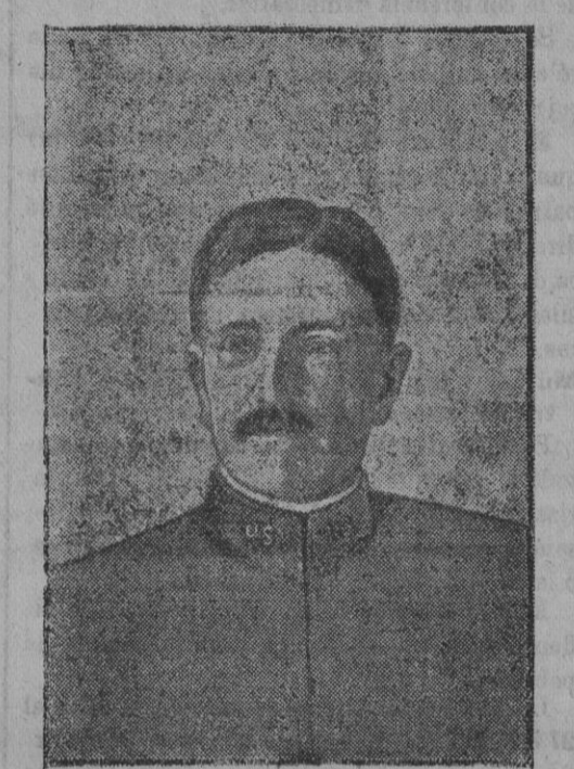
El general americano Pershing.

La población hallábase engalanada con cel- gadores, banderas y gallardetes.