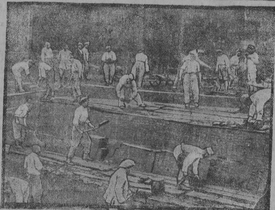
En los Vosgos.—Extracción de turba para sustituir al carbón.

También dijo que había celebrado una con- ferencia con el gobernador para ocuparse de las sublevaciones y buscar los medios de res- tablecer la normalidad en el precio de los ar- tículos de consumo.