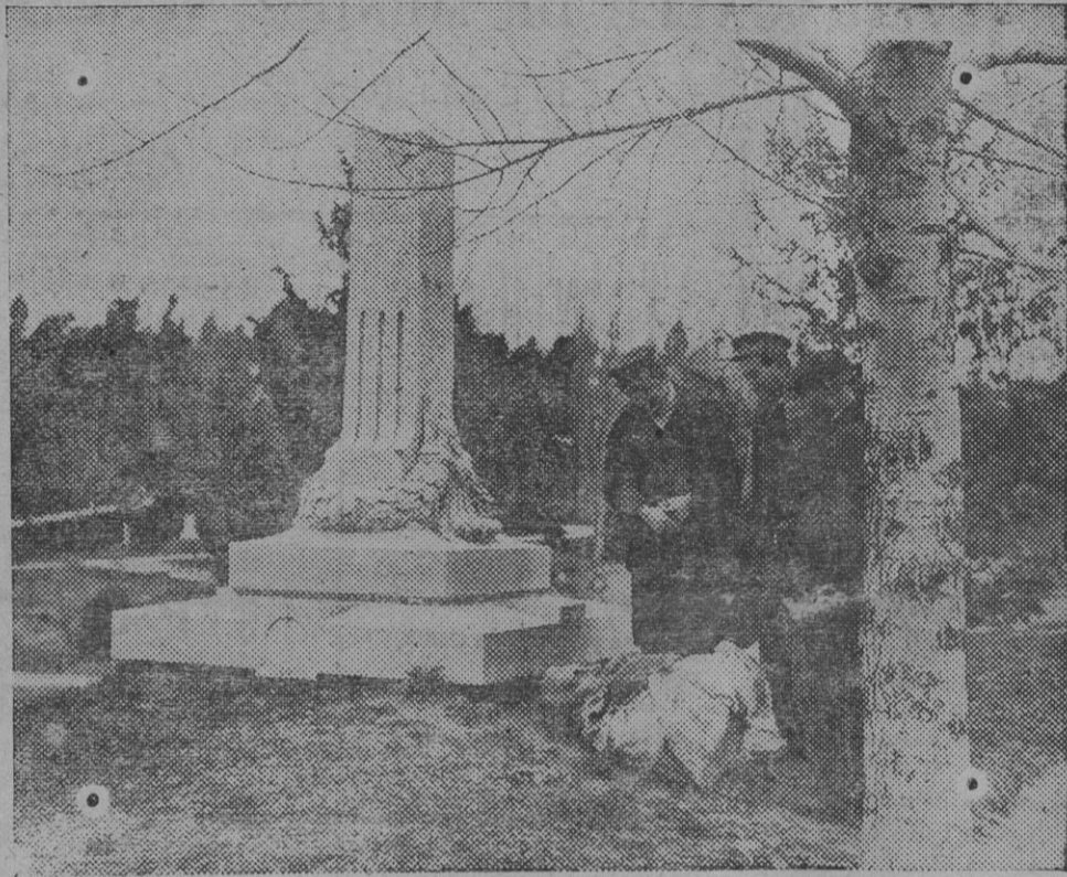
El busto del coronel Ibañez Marín, esperando ser colocado sobre su pedestal.

LOS BUSTOS DE DOS HÉROES EN EL PARQUE DEL OESTE