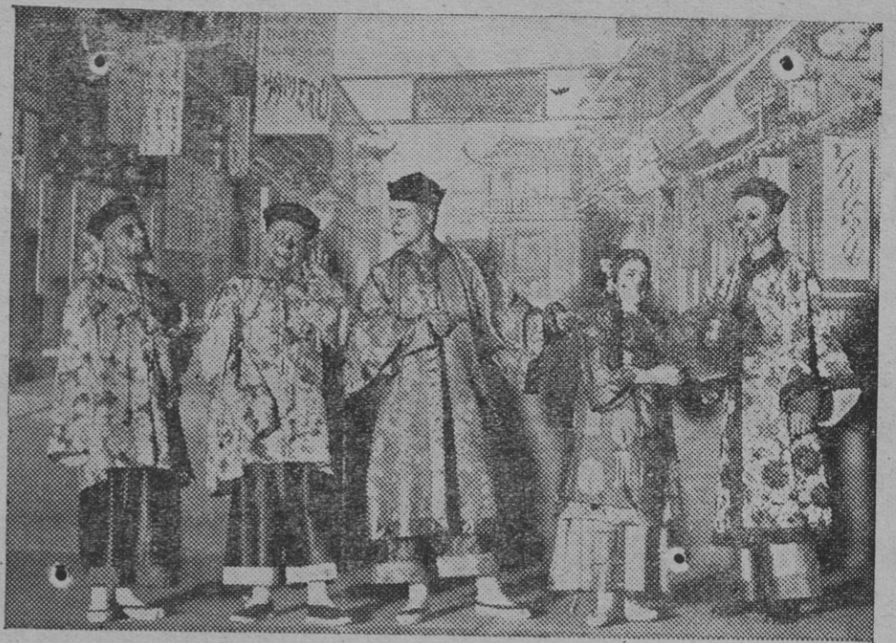
Una escena del segundo acto de «Hijo del Sol», que se ha estrenado en el teatro Apolo.

Las calles están sucias, intransitables; las aceras constituyen un serio peligro para el transeúnte, pues no todos los comerciantes cumplen con las ordenanzas municipales, que mandan que limpien el frente que ocupen los edificios.