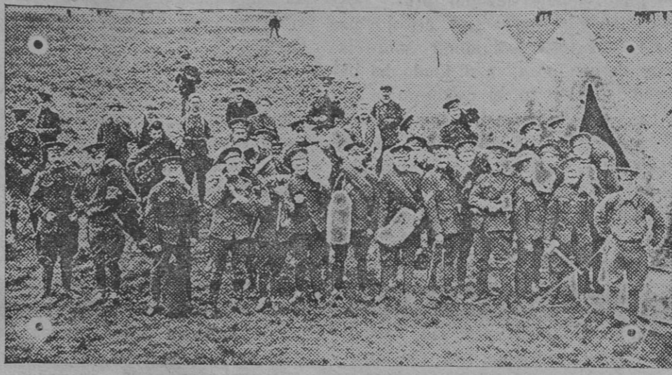
Un campamento de soldados canadienses del ejército inglés que opera en Bélgica.

CADIZ, 5.—Ayer fondeó en este puerto el transatlántico «Manuel Calvo», procedente de la América Central, sin novedad á bordo.