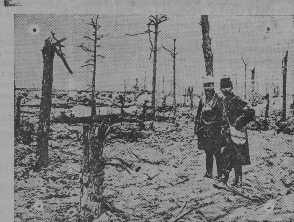
Parque de Sabot (Francia), completamente arrasado por la artillería alemana.

De gran transcendencia es el día de hoy; prólogo de los acontecimientos que pueden ocurrir, ha sido la reunión de ex-ministros de Hacienda liberales y demócratas, que por acuerdo de los señores conde de Romanones y marqués de Alhucemas, se reunieron ayer para es-