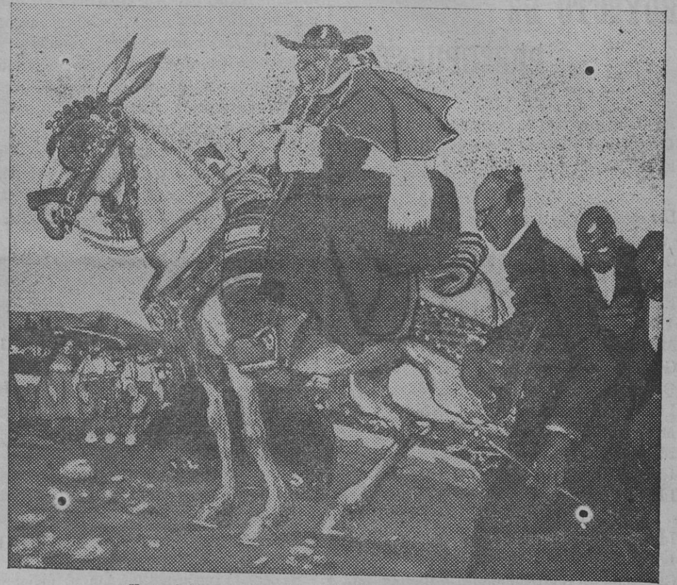
Exposición de caricaturas de Tito.—«Visita pastoral».

Sería propenso á error por nuestra parte el emitir opinión con sólo una rápida lectura de las reformas proyectadas por el Sr. Echagüa. Creemos, sin embargo, que esas reformas, tal como están presentadas, no proporcionan