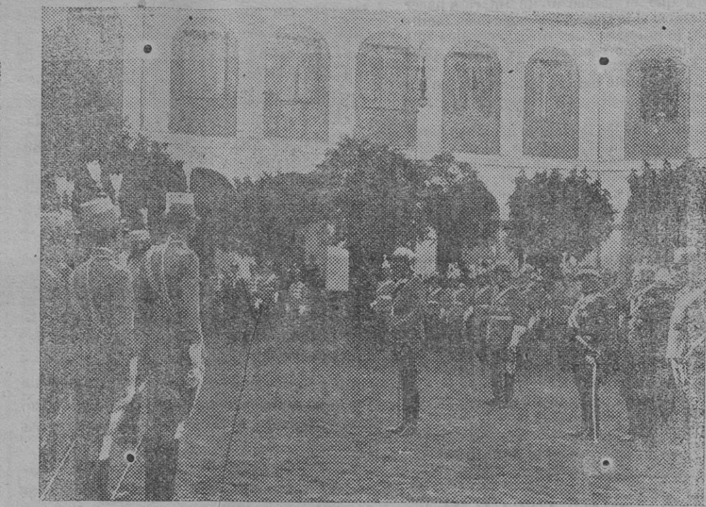
EL REY EN VALLADOLID.—Su Majestad el Rey dirigiendo una alocución a los alumnos de la última promoción de la Academia de Caballería, después de haber jurado la bandera.

Esto lo tienen también en cuenta los alemanes internados en el «Alexandra Palace», de Londres, que están estudiando con gran afán la lengua de Cervan-