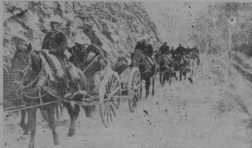
Artillería italiana dirigiéndose a la frontera austriaca.