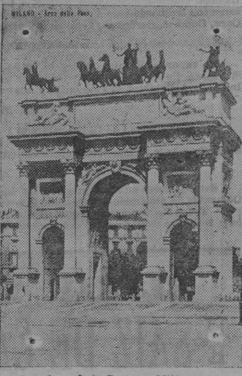
Arco de la Paz, en Milán.

A un maquinista así, hay que sustituirlo.