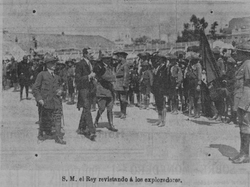
S. M. el Rey revisando á los exploradores.

Los sufridos y heroicos guardias son acometidos y á veces como en Benagalbón mueren apuñalados por mano de los que enfurecidos y sanguinarios no quieren comprender que están cumpliendo con su deber.