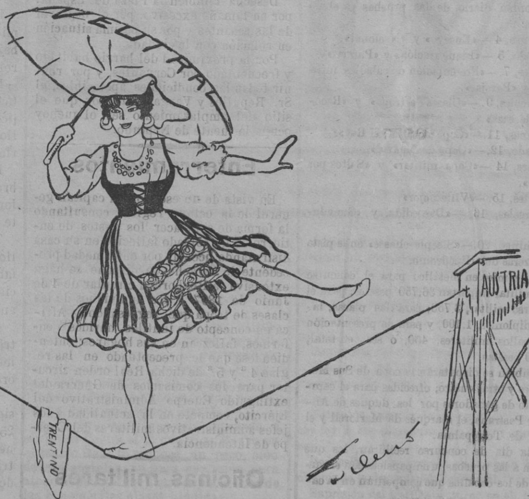
La signorina Italia en la cuerda floja.