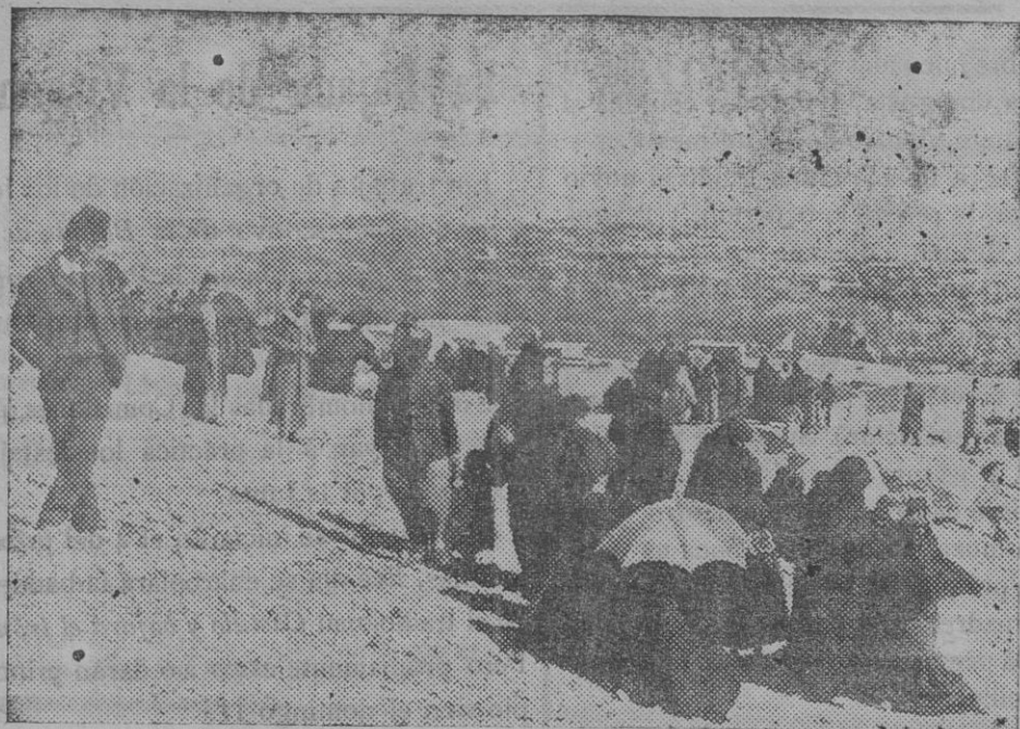
Vista de la ciudad de Damasco.

El general ha visitado también al presidente del Consejo.