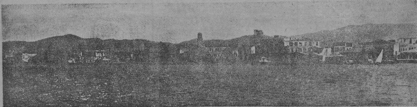
El puerto y la ciudad de Sid-el-Bahr en la costa norte de los Dardanelos.

Telegrafían de Bucarest que el mariscal alemán von der Goltz ha sido recibido en audiencia por el Rey.