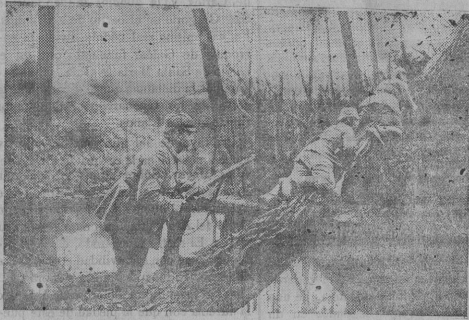
Una avanzada de Infantería en movimiento.