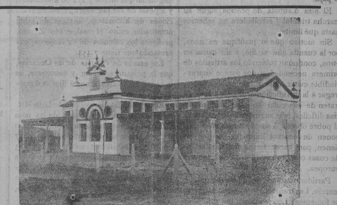
Real Patronato de casas para obreros en Sevilla.—Edificio destinado a escuelas de párvulos en la colonia.

NOTA.—Se dará cuenta en la sección de «Libros de aquellos libros, folletos y revistas, cuyos autores ó editores remitan dos ejemplares.